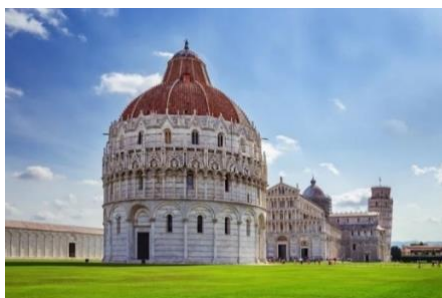
Fig. 14. Baptisterio de San Juan