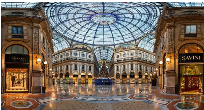
Fig. 5. Galería Vittorio Emanuele II