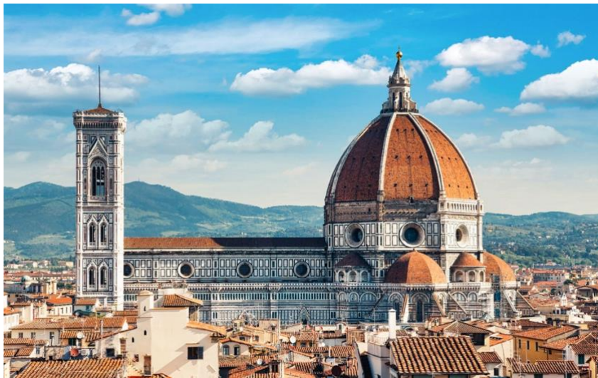
Fig. 7. Catedral de Santa María del Fiore