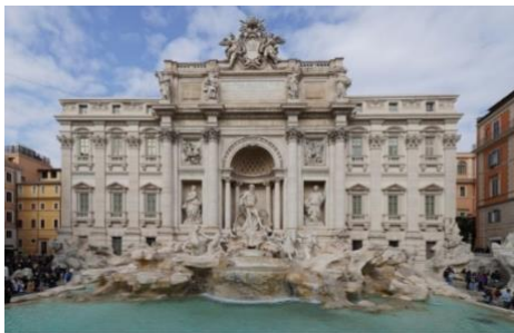
Fig. 2. Fontana di Trevi

Dado que la Fontana di Trevi es una fuente al aire libre, resulta imposible contabilizar todos los turistas que la visitan. No obstante, en 2023 se recolectaron 1.6 millones de euros arrojados por los turistas a la fuente con la esperanza de regresar a Roma.