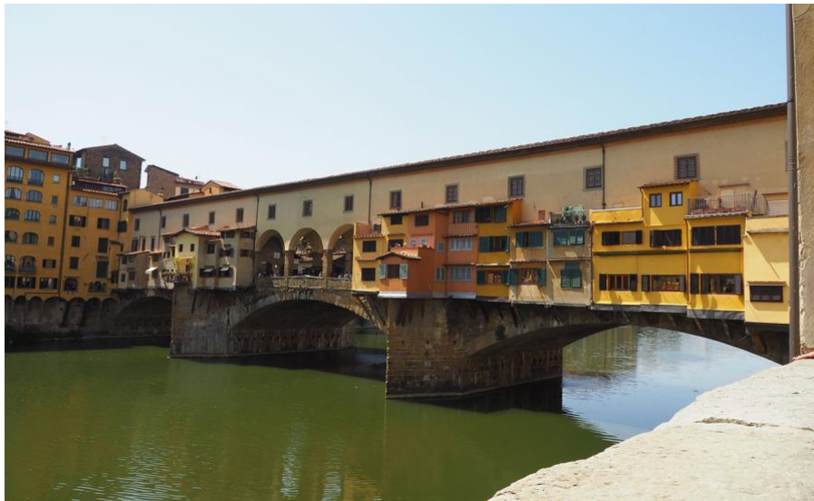
Fig. 8. Ponte Vecchio