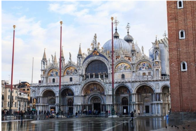
Fig. 9. Basílica de San Marcos.