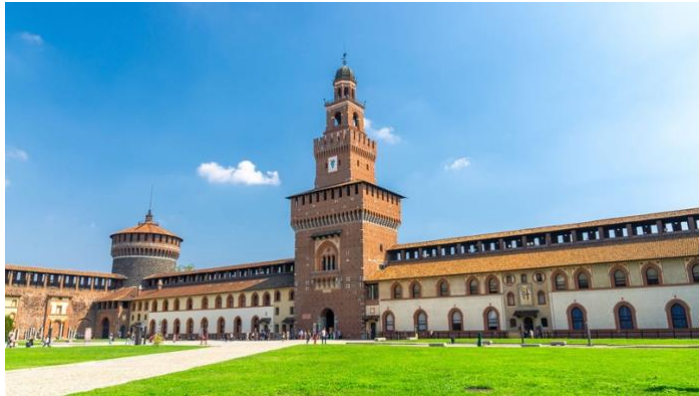
Fig. 6. Castillo Sforzesco