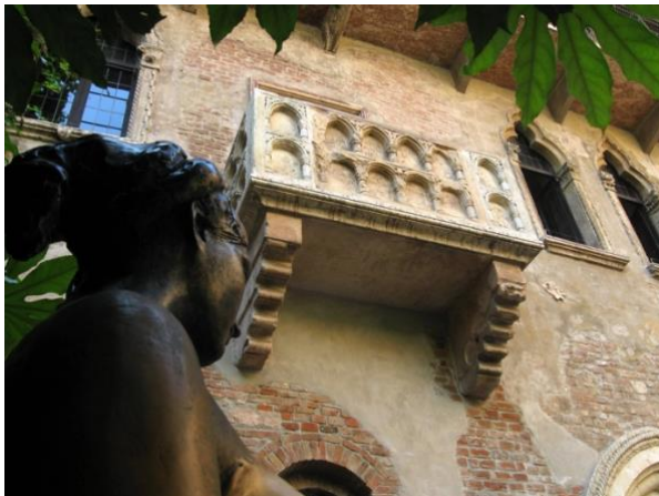
Fig. 12. Casa de Julieta.