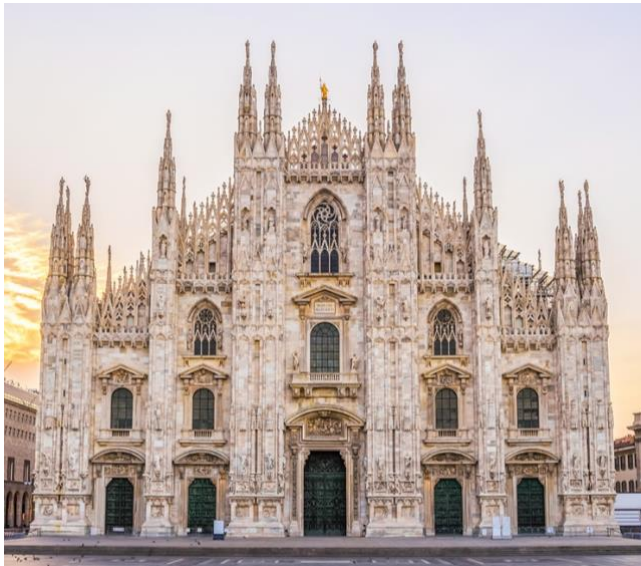
Fig. 4. Catedral de Milán