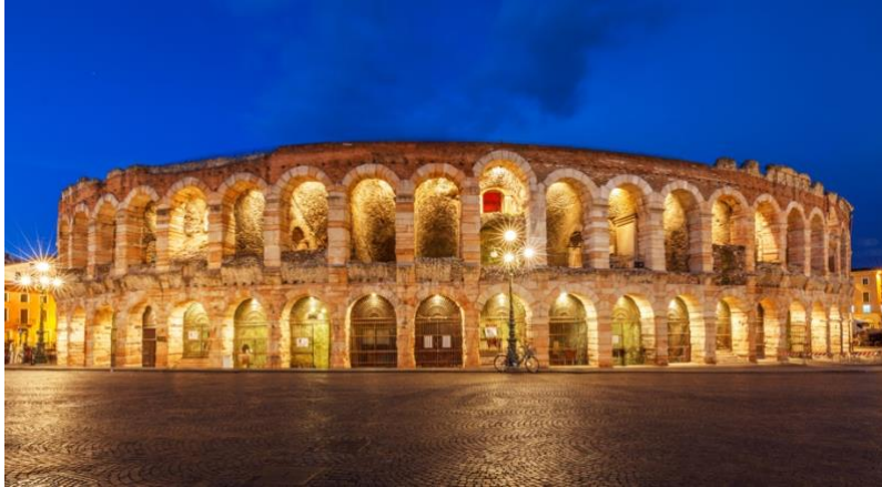
Fig. 11. Arena de Verona