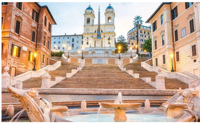
Fig. 3. Escalinata de la Plaza de España