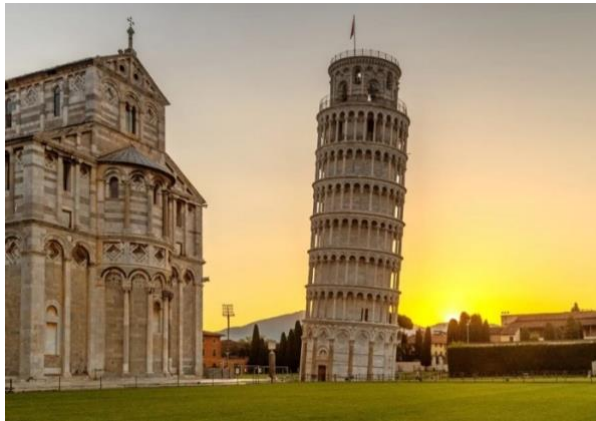
Fig. 13. Catedral de Pisa