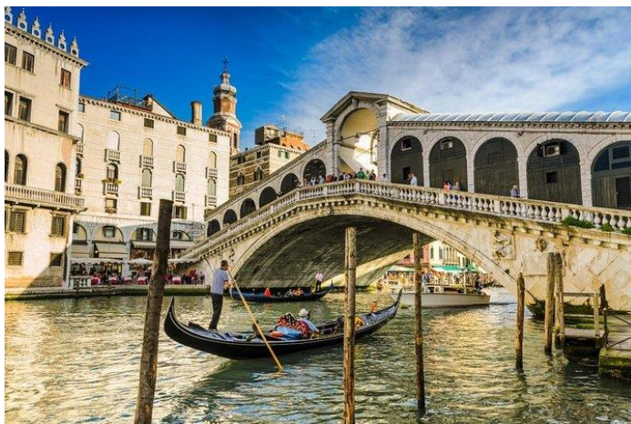
Fig. 10. Puente de Rialto.