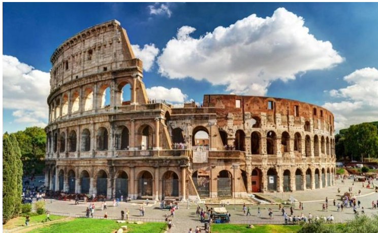
Fig. 1. El Coliseo

Según el periódico italiano Agenzia Nova , durante los meses de verano de 2023, se adquirieron más de 2 millones (2,277,139) de entradas para acceder al Coliseo, el Foro Romano y la Colina Palatina en Roma. Esta cifra representa un incremento de 315,493 visitantes, lo que equivale a un aumento de un 16% en comparación con el mismo período en 2019, año prepandemia.