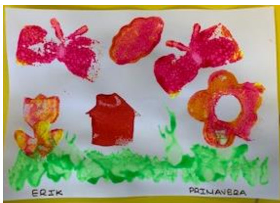
Figura 6. Actividad “Estampado de la primavera”.

En la tercera actividad dentro de esta sesión, los niños escucharon nuevamente la música de "La Primavera" de Vivaldi. Seguidamente, se les organizó en equipos de 4 o 5 niños y niñas, y se les pidió que dibujaran lo que la música les hizo imaginar. Utilizaron la técnica del estampado con esponjas con formas de primavera, como mariposas, flores, nubes y sol, aplicando temperas de colores vivos. Además, para recrear el césped, emplearon la técnica del soplado, soplando pintura líquida a través de pajillas para crear el efecto de la hierba, lo cual se aprecia en la Figura 6.