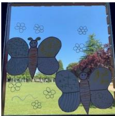
Figura 5. Actividad "Grafismo creativo".

En la segunda actividad, se mostró en la pantalla digital un musicograma de "La Primavera" de Vivaldi, donde cada elemento de la música estaba representado visualmente, trabajando los fenómenos naturales que se dan en la primavera. Al igual que en actividades anteriores, los niños y niñas se dirigieron a la zona de la asamblea y se les entregó una brocheta que llevaba representado en ella el elemento asignado del musicograma, como pájaros, flores, sol, tormenta, etc. Cuando el personaje del musicograma correspondiente a cada niño aparecía en la pantalla, ellos representaban ese elemento al ritmo de la música, moviéndose y bailando mientras sostenían su brocheta, cuando