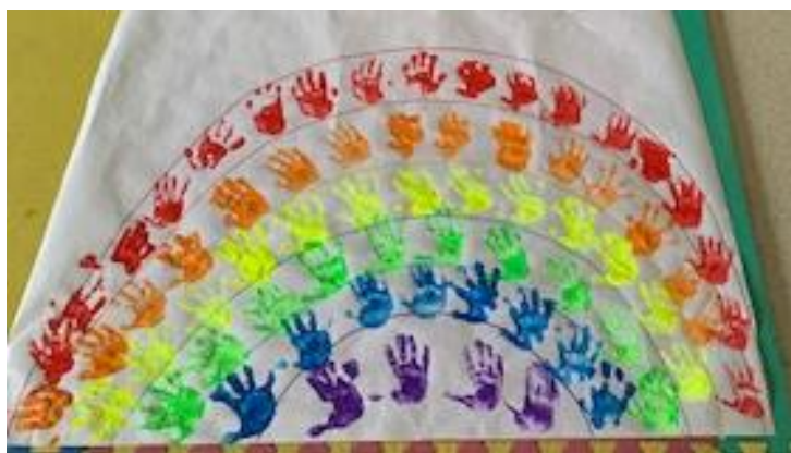
Figura 3. Actividad del arcoíris.

Para la tercera y última actividad, en la zona de asamblea se explicó que se iba a crear una tormenta utilizando el cuerpo para lograr abrir el túnel del arcoíris. Se practicaron diferentes sonidos para simular la tormenta: lluvia fuerte golpeando las manos en los muslos, lluvia suave dando con un dedo en la palma de la mano, y truenos dando palmadas fuertes. Se creó una secuencia que simulaba una tormenta, comenzando de manera suave, aumentando la intensidad y luego disminuyéndola. Cuando la lluvia volvía a ser suave, se abrió el túnel del arcoíris colocado en el centro de la asamblea, como se muestra en la Figura 4. Dando a entender que, cuando la tormenta cesaba y salía el sol, aparecía el arcoíris. A continuación, se explicó que se reptaría bajo el arcoíris mientras se cantaba la canción trabajada en el cuento. Cuando la canción se detenía, los