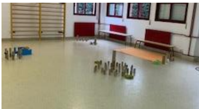
Figura 7. Actividad “Exploramos libremente”.

Antes de entrar a la sala de psicomotricidad, se explicó a los niños que tendrían la oportunidad de experimentar con los materiales que estaban organizados por el suelo de la sala. Una vez dentro, se les permitió explorar libremente los materiales y experimentar con las texturas y los colores, también se les permitió explorar creando sonidos golpeando, frotando o manipulando los objetos según su curiosidad e imaginación.