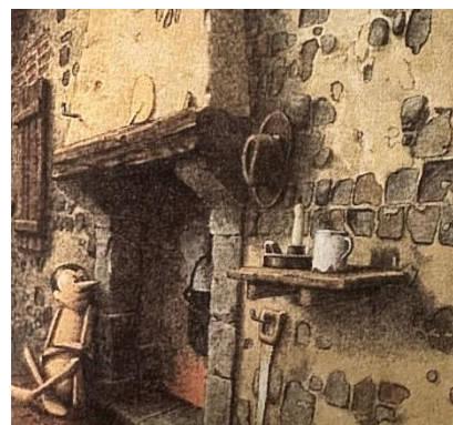
Imagen 6. Realismo Pinocho. R. Innocenti (1989)