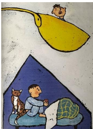
Imagen 5. Expresionismo Y se lleva a los niños que comen poco. Josephus Jitta (2002)