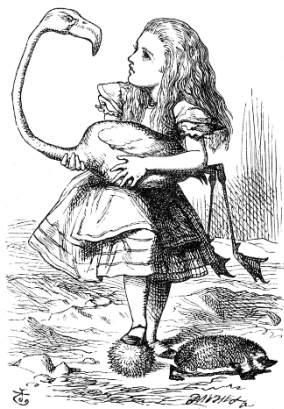
Imagen 7. Alicia . John Tenniel

Las ilustraciones se adaptan a la sociedad y a los estilos artísticos predominantes en el momento de publicación de una obra, por lo cual, tenemos la posibilidad de ver la diferencia en el dibujo de niñas en los cuentos, desde la utilización de la plumilla a la acuarela: