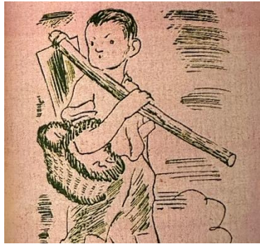
Imagen 2. Neocentismo. En Mateu. Josep Obiols (1933)