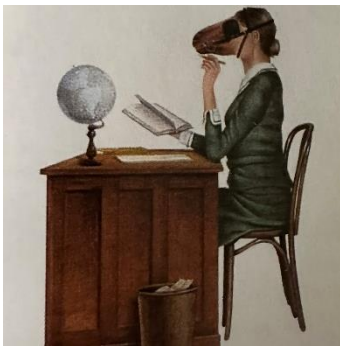
Imagen 3. Surrealismo. Le Géranium sur le fenetre. A. Cullum (1971)