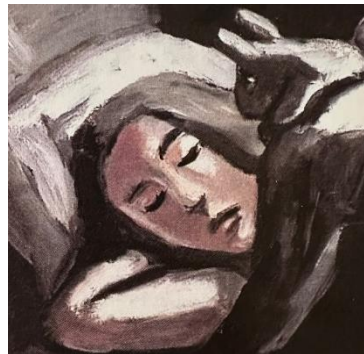
Imagen 4. Fauvismo Le petit fille du libre. Nadja (1997)