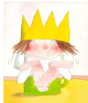
Imagen 8. Pequeña princesa . Tony Ross

La diferencia se puede ver más claramente entre ilustraciones donde se representa un mismo personaje en diferentes momentos de la historia, en esta ocasión podemos ver como Gustave Doré ilustró a Caperucita roja de una forma realista, sin embargo, Keveta Pacovska represento a la niña de Caperucita roja más lejos de la realidad.