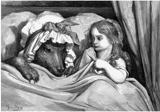
Imagen 9. Caperucita roja . Gustave Doré