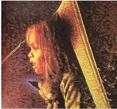
Imagen 1. Puntillismo. The garden. Gary Blithe (1993)