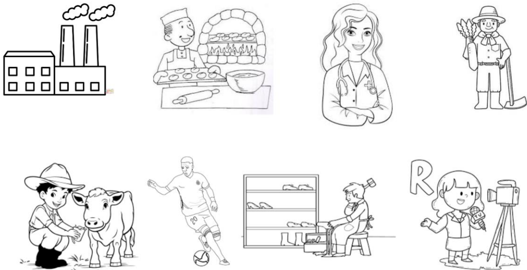
Fig. 4. Ficha para colorear los oficios del pasado.