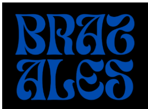
Figura 9. Uso incorrecto