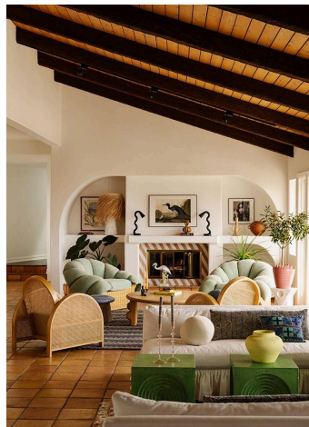
Figura 17. RANCHO PELICANO