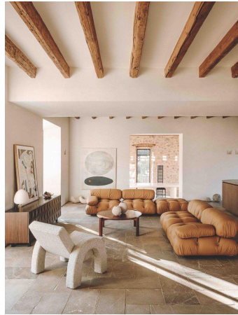
Figura 16. El rey de los sofás de diseño es italiano, nació en los 70 y arrasa en las redes

- Publicaciones de Proyectos: A través de fotos y videos de alta calidad, BRAZALES mostrará proyectos completados, desde el concepto inicial hasta la realización final. Este contenido no solo destacará la estética final de los diseños de interiores, sino que también documentará el proceso creativo y de ejecución, proporcionando una visión completa y transparente que resonará con los seguidores interesados en el diseño de interiores. como somos una empresa que todavía no ha realizado ningún proyecto, a continuación mostramos un ejemplo de post ya existente: