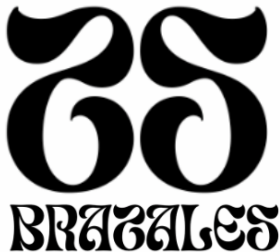
Figura 1. Imagotipo del Estudio de Interiorismo.

Este apartado tipográfico lo analizaremos más adelante. Además, el imagotipo del estudio jugará un papel crucial en nuestra identidad visual. Un buen imagotipo no solo debe ser estéticamente agradable, sino también reflejar los valores y la filosofía del estudio. La elección de un imagotipo adecuado ayudará a posicionarnos como un referente en el mercado y a crear una conexión emocional con nuestros clientes potenciales.