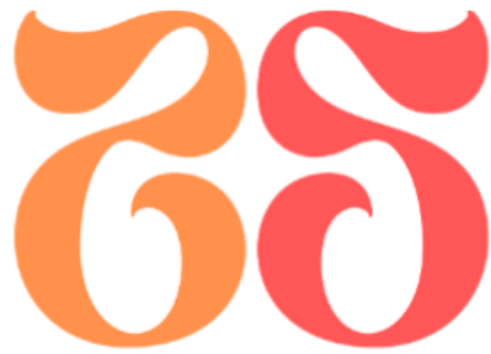
Figura 7. Uso incorrecto