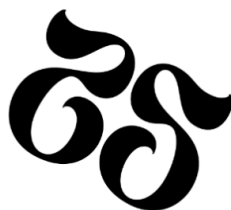
Figura 6. Uso incorrecto

Algunos usos incorrectos de este logotipo sería introducir color a las propias letras, ponerlo en fondos oscuros con la tipografía negra, girar el logotipo, etc.