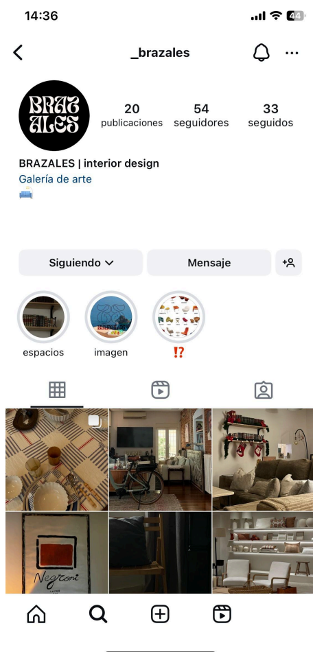
Figura 21. Perfil BRAZALES

- Instagram: Utilizar Instagram como la plataforma principal para compartir contenido visualmente atractivo, incluyendo imágenes de alta calidad, videos, stories y reels. Esta plataforma dinámica permitirá a BRAZALES conectar de manera efectiva con su audiencia, mantener un flujo constante de contenido fresco y promover campañas y promociones de manera efectiva. A continuación mostraremos una captura de pantalla del actual perfil de BRAZALES, se ve que es un perfil amateur ya que no cuenta con proyectos ni numerosos seguidores debido a que todavía no se han realizado trabajos en este área.