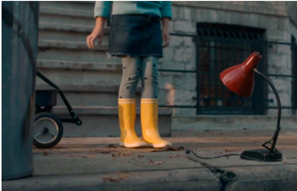
Figura 23. Frame Anuncio Ikea Lamp 2.

La famosa campaña "Lamp" de IKEA tiene una continuación llamada "Lamp 2", recientemente lanzada. Este anuncio se vale de la nostalgia y manipula las expectativas del público para promover su mensaje sobre sostenibilidad y reutilización, mostrando una lámpara roja abandonada en la calle y dando un toque de personificación a la figura principal. Muestra como un simple objeto puede cambiar nuestras vidas ya que están presentes en la imaginación de los más pequeños.