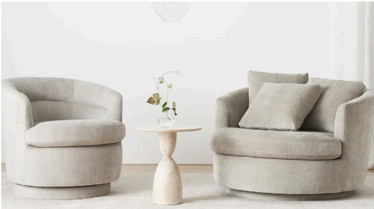
Figura 24. Pop-up West Elm.

El blog de West Elm, una destacada compañía en la industria del mobiliario y decoración, ha creado con gran éxito la campaña "Front + Main". En dicho blog se comparte contenido inspirador sobre diseño interior, tendencias decorativas y proyectos de hágalo usted mismo. El objetivo de esta campaña es compartir historias genuinas que inspiren y brinden conocimiento a nuestros lectores. Presentamos recorridos por hogares reales decorados con productos de West Elm, artículos sobre las últimas tendencias en diseño, tutoriales detallados para crear elementos decorativos personalizados y anuncios de colaboraciones con diseñadores influyentes. West Elm ha logrado fidelizar a sus clientes, aumentar la visibilidad de sus productos y posicionarse como líder en el sector del diseño de interiores al ofrecer contenido útil y atractivo. Además, también fomenta la creatividad y el bricolaje, creando una comunidad en torno a su marca.