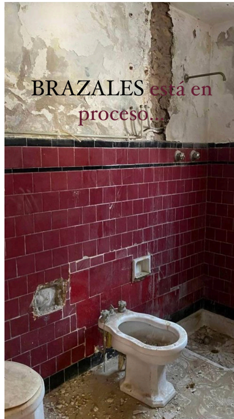
Figura 19. Reformas casa de pueblo antes y después

perspectiva auténtica y transparente. Desde reuniones de brainstorming hasta visitas a sitios de proyectos en curso, este contenido involucrará a la audiencia al ofrecer un vistazo exclusivo detrás de las cortinas, fortaleciendo así la conexión y la confianza con los seguidores.