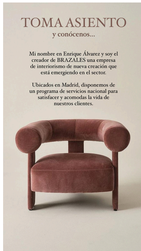
Figura 18. SABANA lenestol.

- Historia de la Empresa: A través de contenido narrativo y visual, BRAZALES compartirá la historia de la empresa, destacando sus valores fundamentales, filosofía de diseño y su trayectoria en el mundo del diseño de interiores. Esta narrativa no solo sirve para establecer la identidad de la marca, sino también para conectar emocionalmente con la audiencia al mostrar la pasión y el compromiso que impulsan cada proyecto de BRAZALES.