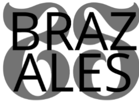
Figura 8. Uso incorrecto