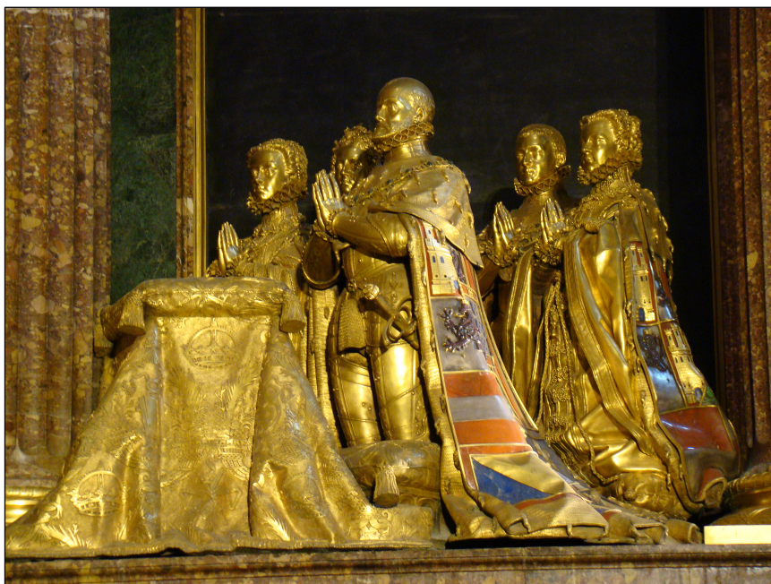
Fig. 4. Pompeo Leoni, grupo escultórico de la Familia de Felipe II, Real Monasterio de El Escorial, Patrimonio Nacional (vista lateral).

Pero la liquidación definitiva de todas las cuentas, como se desprende de toda esta información administrativa, no terminó sino, al menos, hasta 1604. Por ejemplo, y con relación a estos retrasos, en marzo de 1604 se le adeudaba aún a Pompeo Leoni su salario de 50 ducados mensuales correspondiente a los meses de diciembre de 1598 y de enero de 1599 25 .