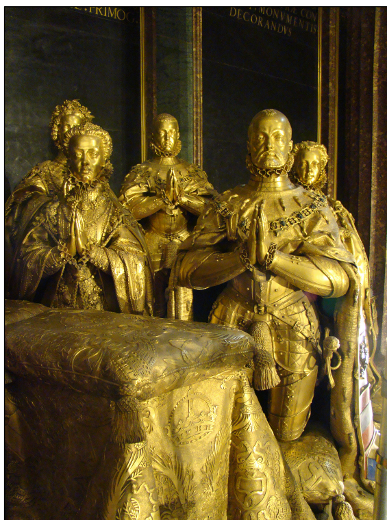
Fig. 3. Pompeo Leoni, grupo escultórico de la Familia de Felipe II, Real Monasterio de El Escorial, Patrimonio Nacional (vista lateral).

Los pagos y otras noticias de carácter administrativo relativos a los trabajos seguidos para el cenotafio de Felipe II, así como para su colocación, que tuvo lugar el 22 de octubre de 1600, se hallan bien documentados por Mulcahy, Bustamante y Pérez de Tudela, entre otros autores 24 .