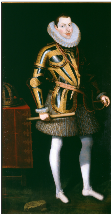
Fig. 5. Juan Pantoja de la Cruz, Felipe III, 1605, Real Biblioteca de El Escorial, Patrimonio Nacional.