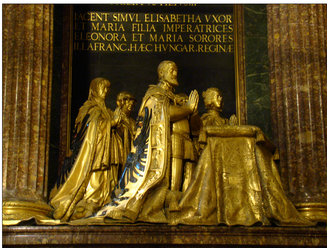
Fig. 2 Pompeo Leoni, grupo escultórico de la Familia de Carlos V, Real Monasterio de El Escorial, Patrimonio Nacional.

El grupo del emperador había sido ejecutado, reparado y colocado en un plazo aproximado de seis años. Ahora, el nuevo contrato fijaba tan sólo un tiempo de dieciocho meses, desde el 1 de enero de 1597 hasta fines de junio de 1598 22 .