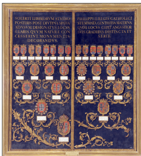
Fig. 8. Atrib. a Fabrizio Castello, Genealogía de Carlos V, Real Monasterio de El Escorial, Patrimonio Nacional.

Que se tendrá cuenta de ir visitando de ordinario esta obra, para que las figuras puedan estar puestas para la fiesta de San Lorenzo; y se haga en todo lo que conviene.