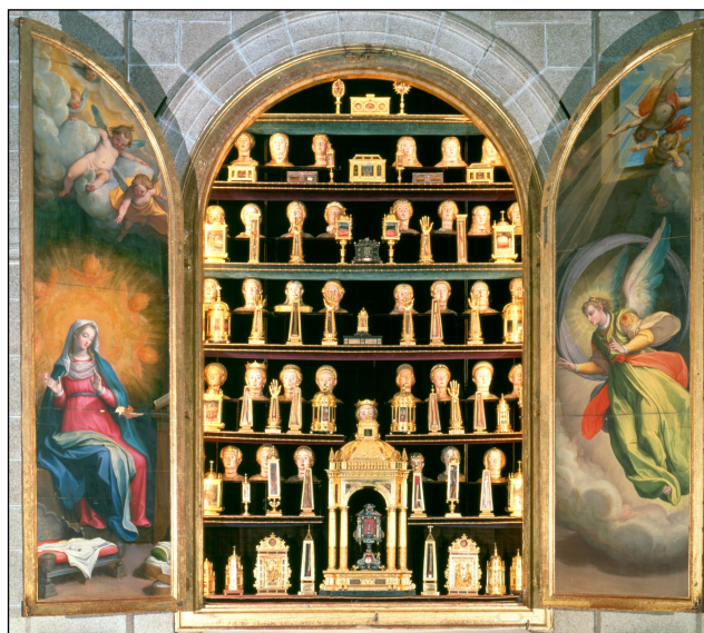
Fig. 6. Federico Zuccari, armario-relicario de La Anunciación con los bustos-relicarios femeninos de Juan de Arfe y Lesmes Fernández del Moral, Real Monasterio de El Escorial, Patrimonio Nacional.

Magd. que, entendiendo los ministros que valdría mil ducados cada mes, no vale 500, porque las condenaciones de penas de cámara de los lugares de señorío que entraban en ella se han adjudicado por el Consejo a los señores de ellos, y así ha bajado mucho esta renta.