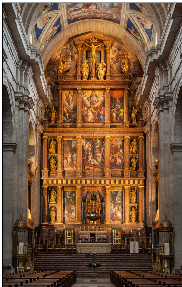
Fig 1. Retablo Mayor de la Basílica del Real Monasterio de El Escorial.

El abundante material documental referido a estas obras contrasta con la ausencia del contrato original suscrito entre Felipe II y Pompeo para la realización de los Entierros. Mulcahy cree que puede datar de fines de marzo de 1590, una vez terminada la obra escultórica del Retablo 8 . Por su parte, Bustamante piensa que no llegaría a establecerse contrato alguno, «sino nuevas disposiciones y normas al contrato [la Compañía de Trezzo, Leoni y Comane] de 1579, algo muy característico de Felipe II, y usado continuamente durante la edificación y ornato de San Lorenzo el Real » 9 . Mientras, Pérez de Tudela prueba documentalmente que ya en 1592 Pompeo Leoni se hallaba trabajando en el proyecto 10 . En efecto, ese año el maestro de cantería y escultor italiano Baltasar Mariano, ayudante de Pompeo Leoni en su taller milanés al menos desde 1584 en la obra de bronce de las esculturas del