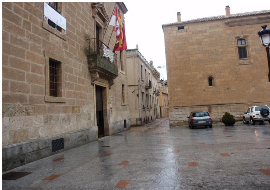
Esquina entre la calle Cáceres y la Plaza del Jazmín