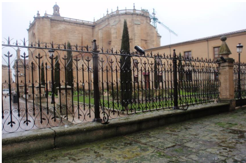
Plaza del Obispo Mazarrasa