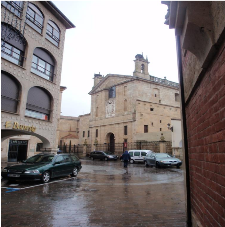
La Capilla de Cerralbo desde la esquina a la calle del Cardenal Pacheco