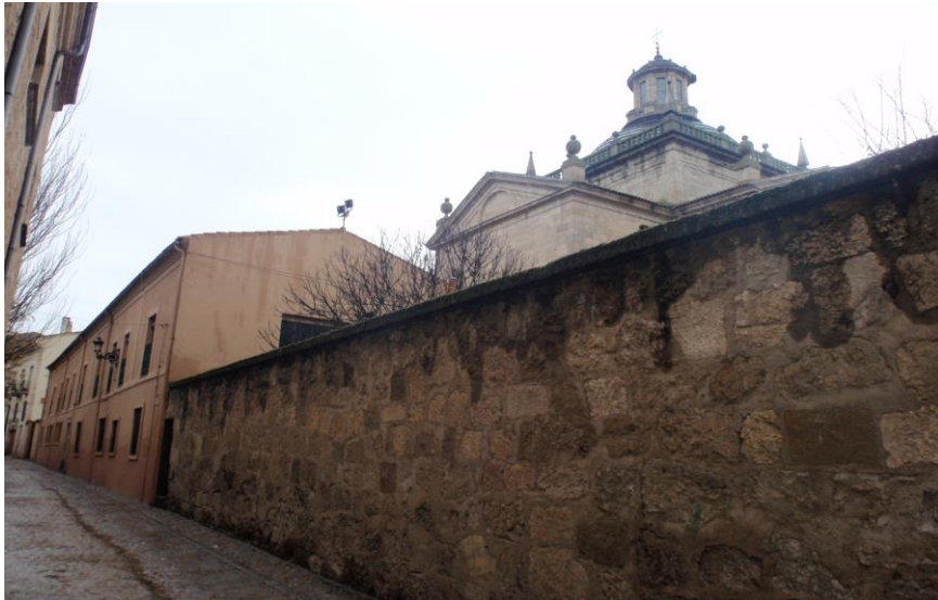
Calle Cáceres con el edificio de la Guardería