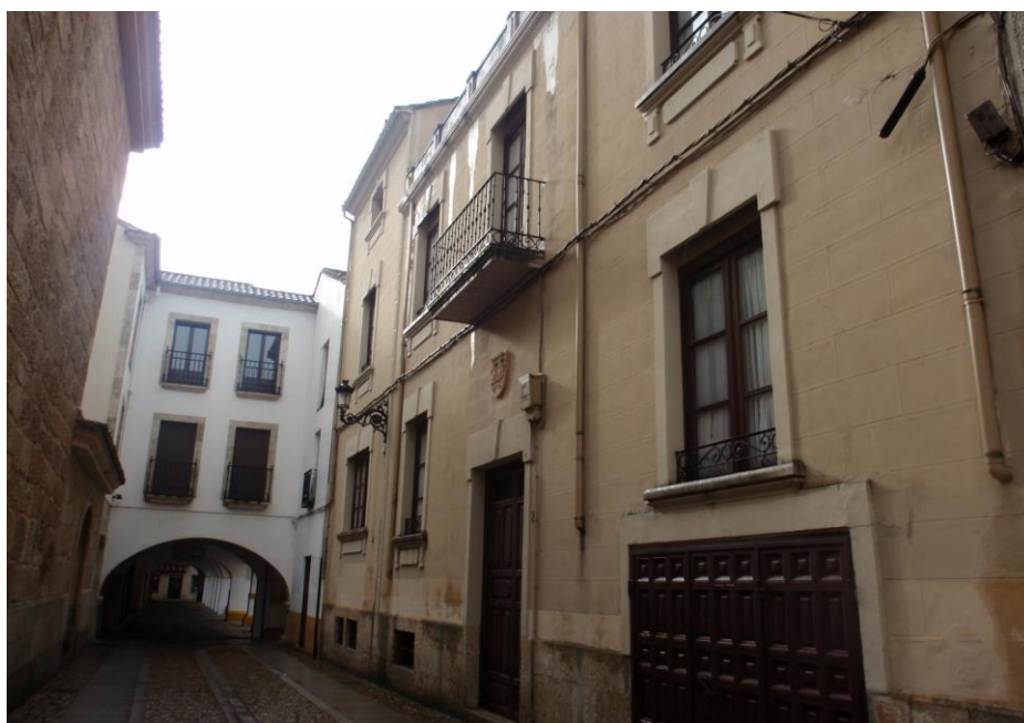
Plaza del Jazmín hacia la entrada a la Plaza del Buen Alcalde