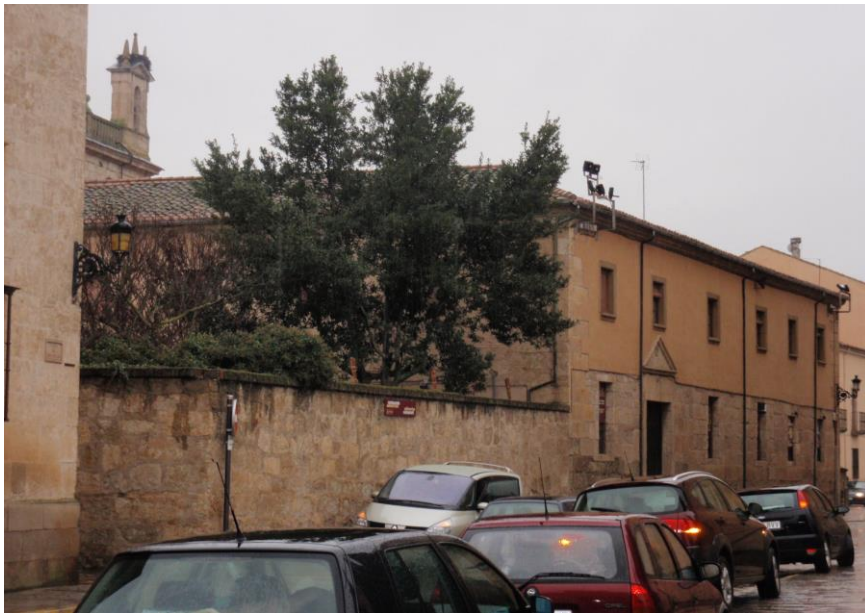
Antigo Convictorio y solar esquina a la calle Cáceres