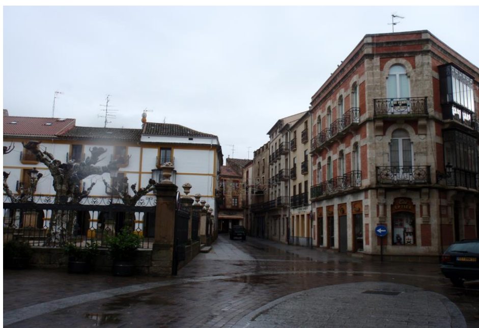
Esquina Plaza del Buen Alcalde con la calle de Julián Sánchez