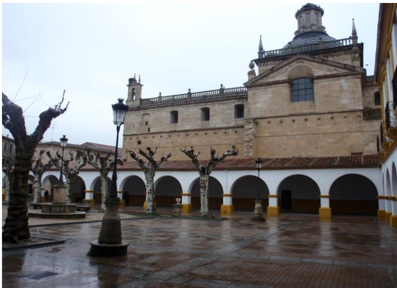
Plaza del Buen Alcalde y Capilla de Cerralbo