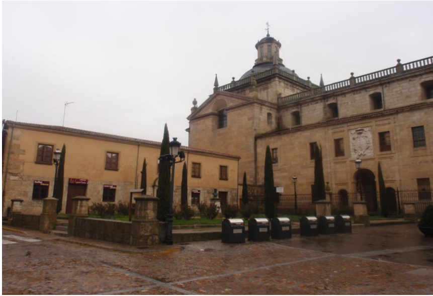
Capilla de Cerralbo y Antigo Convictorio