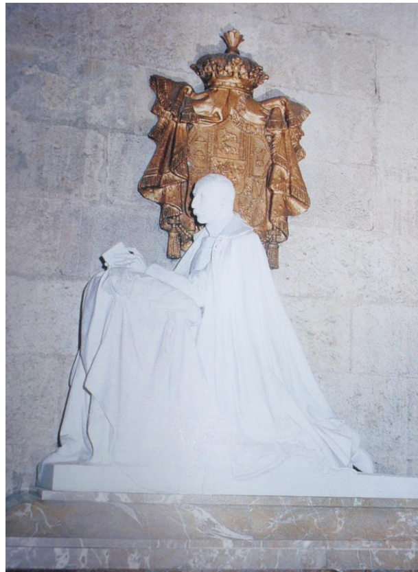
Mausoleo del XVII Marqués de Cerralbo, obra de Mariano Benlliure