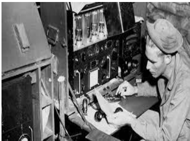
Figura Número 3: 2ª Guerra Mundial.