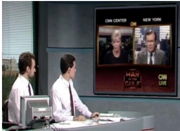
Figura Número 5: Canal CNN Guerra Golfo Pérsico

cual crearon un concepto de visión de medios que hacía cambiar las percepciones de las sociedades.