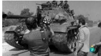
Figura Número 6: Guerra de Vietnam