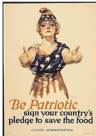
Figura Número 2: Be Patriotic, 2ª Guerra Mundial.