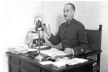
Figura Número 4: Guerra Civil