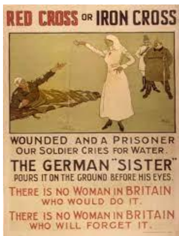
Figura Número 1: Cruz roja o cruz de hierro, 1ª Guerra Mundial

Alguno de los aspectos más significativos que impactaron: