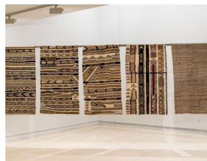
Imagen 7, 8, 9 y 10. Vista de la exposición (2022).