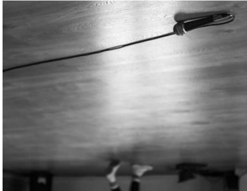
Imagen 11. ‘Bailar el tiempo’. Proyectos LABIVAM.