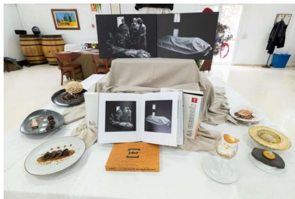
Imagen 21. “Entre fogones”. La cocina en el CAAM.