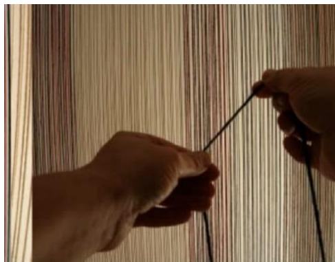
Imagen 6. Programa Articulacions. Tejer con las manos.