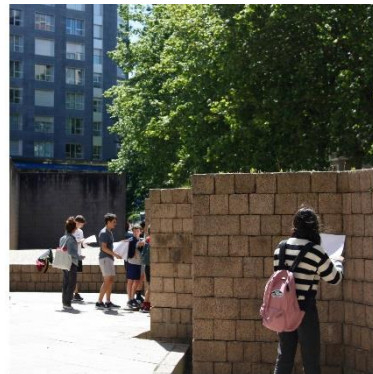
Urbanismo, arquitectura y arte Primaria, ESO, Bachillerato

Imagen 3 y 4. Ejemplos de programas para la comunidad educativa desde el Artium Museoa.