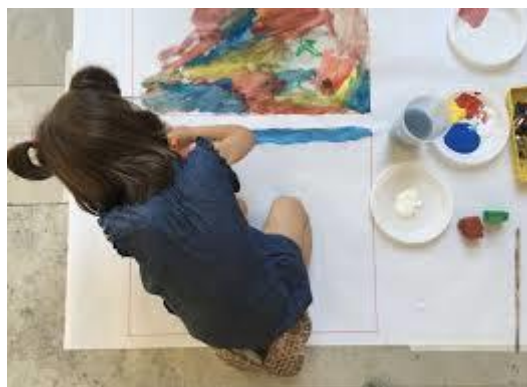
Imagen 2. Construir la mirada. Programa educativo para la comunidad escolar.