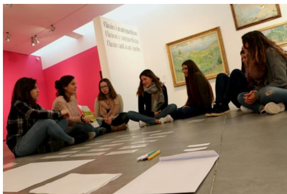
Imagen 22. Visita-taller de estudiantes de secundaria. Opina, no et tallis!