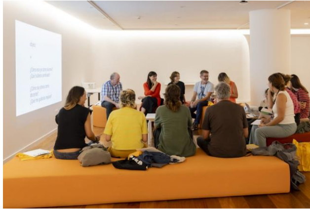
Imagen 15. Grupo de experiencias compartidas: expertos-profesorado.