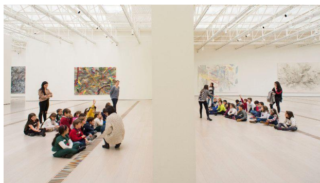
Imagen 19. Grupo de alumnos en las exposiciones de ReflejArte.