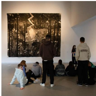
Arte, cine y filosofía ESO, Bachillerato