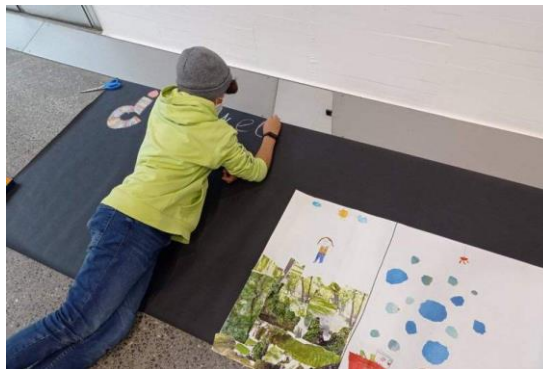
Imagen 1. Programas de educación no formal en el MUSAC.