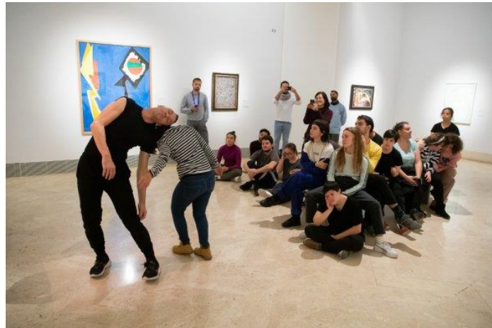
Imagen 17. Danza en sala. MU_DA. Museo y danza.