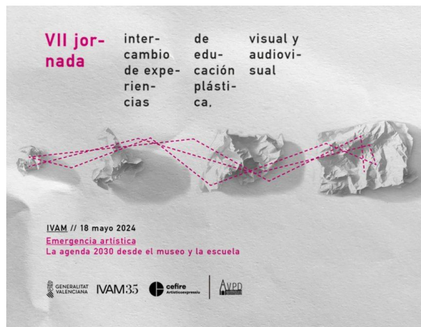
Imagen 12. Cefire 2024. VII Jornada de intercambio de experiencias didácticas de Educación plástica, visual y audiovisual para el profesorado.