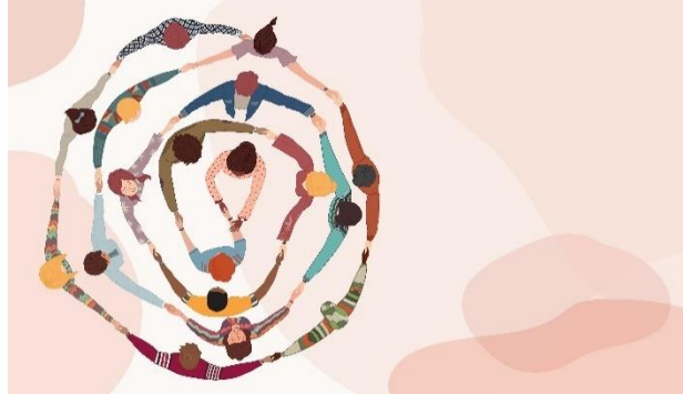
Imagen 20. Consumidores comprometidos en el IES Jose Saramago