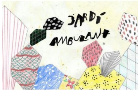
Imagen 13. Cómo el ejercicio de construir comunidad se convierte en el ‘Jardín ambulante’ (MACBA). Conferencia de Educación en el marco de la celebración del DIM.