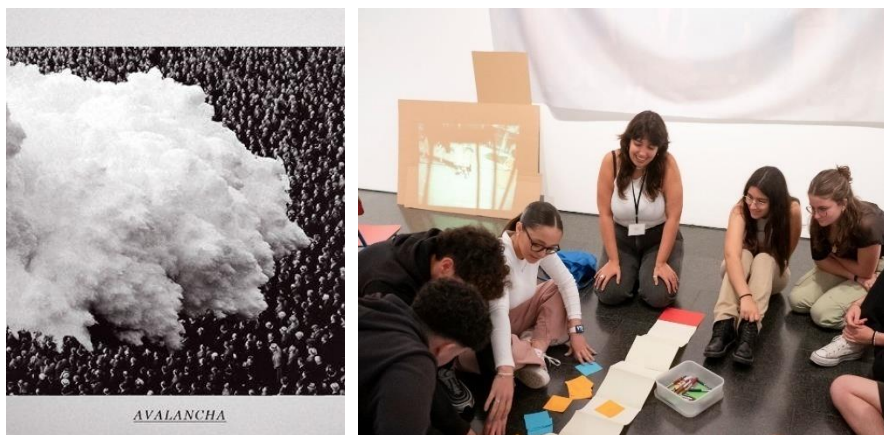
Imagen 5. Propuesta comunicativa desde el MACBA.