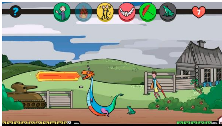
Imagen 16. Imagen de uno de los escenarios del videojuego inclusivo “The Dedal Games”.