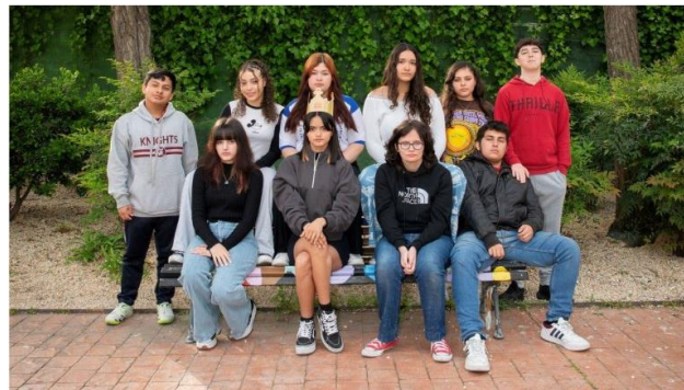
Imagen 18. Generación Reina. Una adolescencia real.

Un proyecto escénico de teatro comunitario y creación colectiva.