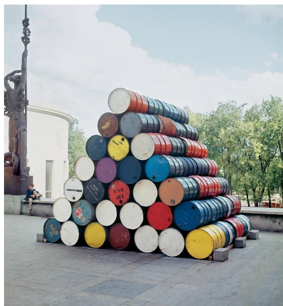
Figura 6. Christo, 1961, Oil Barrels Column . Gentilly. [Fotografía de Raymond de Seynes].