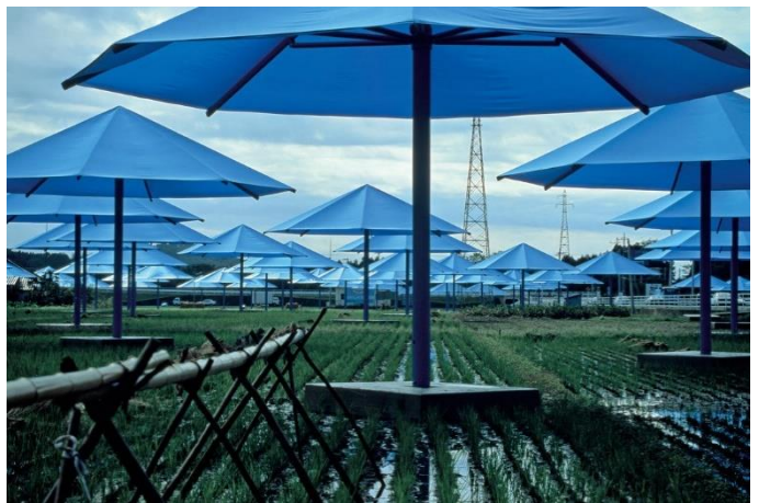
Figura 4. Christo and Jeanne-Claude, 1984-91, The Umbrellas . EEUU. [Fotografía de Wolfgang Volz]. ©1991Christo