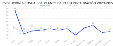
Evolución concursos y planes de reestructuración de enero a abril 2024

En el primer cuatrimestre de 2024 se han contabilizado 3.053 procedimientos concursales con un crecimiento del 48%. Los planes de reestructuración registrados en estos primeros cuatro meses están liderados por Construcción y actividades inmobiliarias, con 24, seguido muy de cerca por los 23 de Comercio.