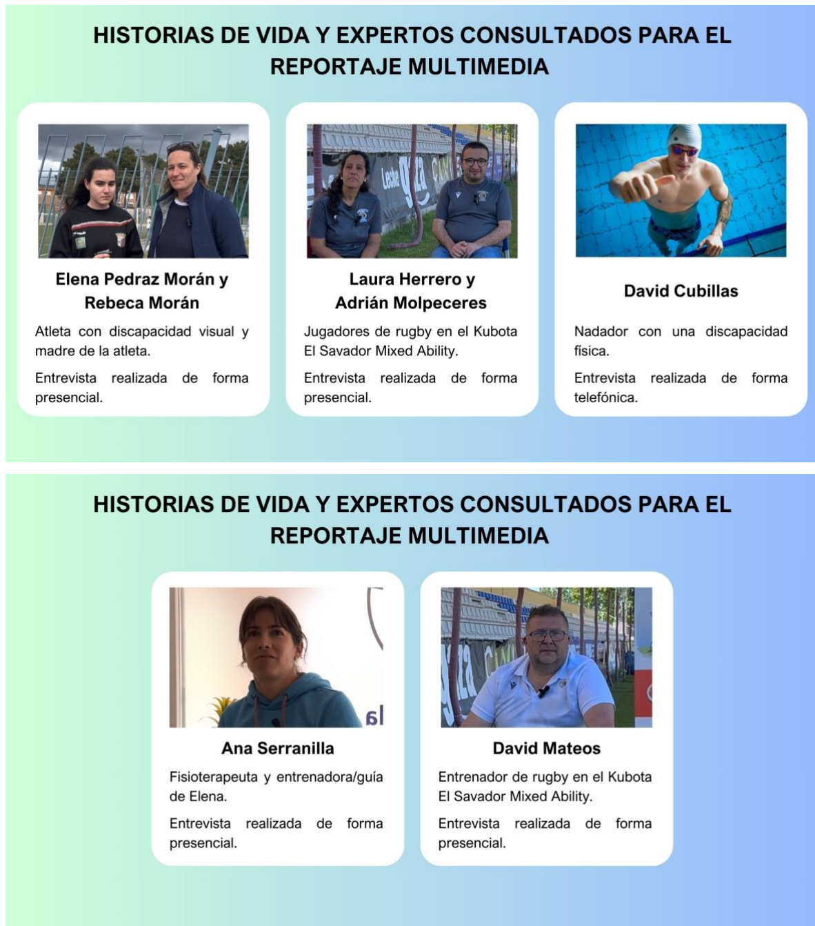
Figura 1. Fuentes consultadas para el reportaje multimedia