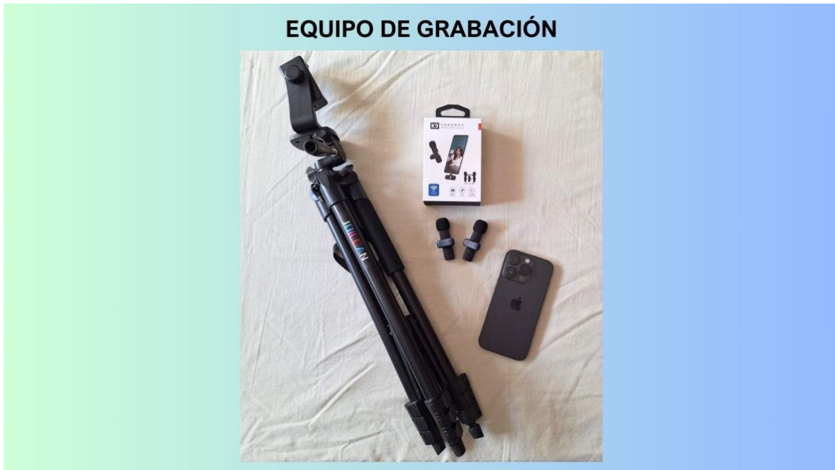
Figura 2. Equipo de grabación