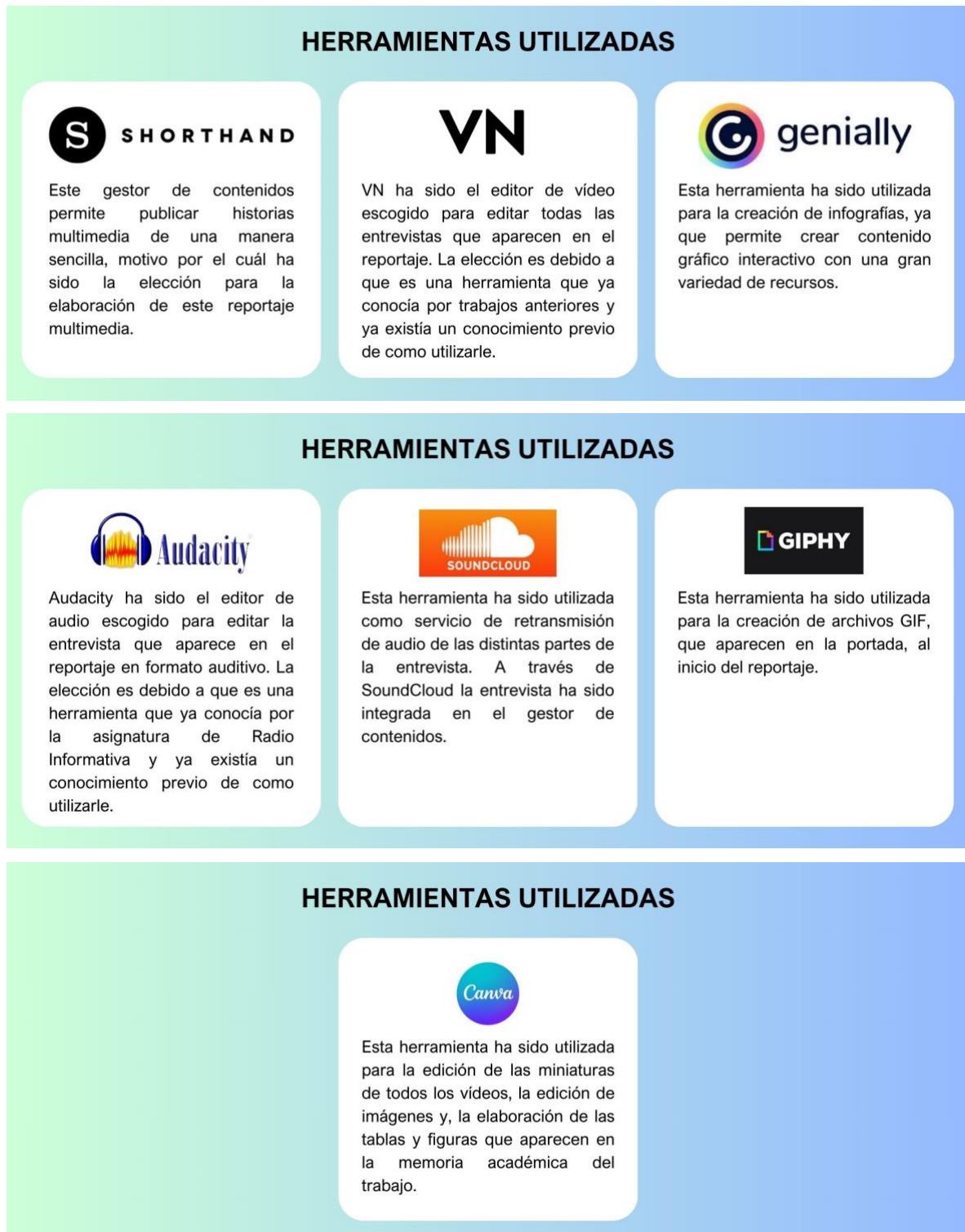
Figura 3. Herramientas utilizadas para el reportaje