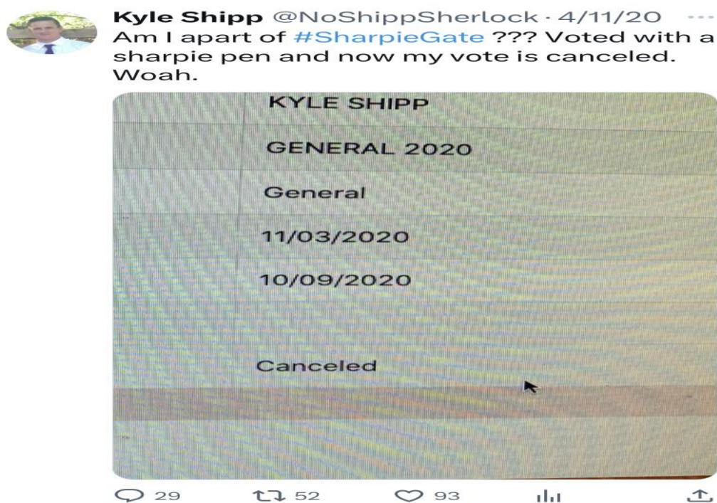
Imagen 4.3: SharpieGate.