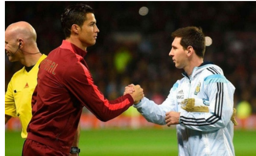
Cristiano Ronaldo y Leo Messi en un partido de selecciones.

El jugador luso ya debutó con 17 años en el Sporting de Portugal, mientras que el argentino dio el salto al primer equipo del Fútbol Club Barcelona en un partido oficial ante el Espanyol el 16 de octubre de 2004, con la misma edad que el portugués. Ambos han