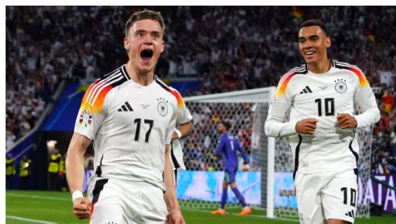
Wirtz y Musiala, las perlas germanas.

En la más rigurosa actualidad futbolística, la Eurocopa 2024, los dos primeros goleadores del campeonato han sido Florian Wirtz y Jamal Musiala, ambos con 21 años de edad. El primero de los dos, Florian Wirtz, se convirtió en el jugador alemán más joven de la historia en marcar en una Eurocopa, mientras que Jamal Musiala ocupa la segunda plaza. Según Sofascore , Wirtz, en la temporada 23/24 de la Liga Alemana anotó 11 goles, con un 9,00 de goles esperados o (xG) y repartió 11 asistencias con un 9,75 de (xA). El alemán tuvo una precisión del 85% en pases y recuperó 4,5 balones por partido en el campeonato germano. Jamal Musiala ya ha disputado 163 partidos con el primer equipo del Bayern de Múnich,