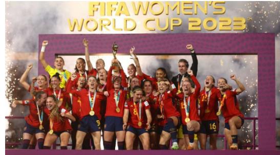
"La Roja" celebrando el Mundial Femenino.

Las españolas Alexia Putellas y Aitana Bonmatí son las grandes figuras del fútbol femenino en los últimos años, sus registros y los títulos obtenidos tanto a nivel individual como colectivo demuestran su enorme impacto en el deporte. La primera de ellas ha recibido en dos ocasiones el galardón del Balón de Oro, en 2021 y 2022, mientras que Aitana Bonmatí lo ganó en el año 2023. Aitana defendió la camiseta de la Selección Española en la Eurocopa sub-17 en 2015, cuando su selección levantó el título y a nivel individual recibió el premio a mejor jugadora del torneo. Dos años después, en 2017, venció la Copa de la Reina y la Eurocopa sub-19.