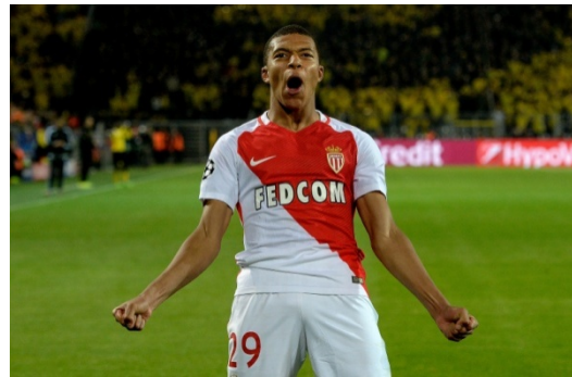
Mbappé en el AS Monaco.

El delantero francés Kylian Mbappé ha batido gran cantidad de récords y desde sus 18 años es considerado como uno de los mejores jugadores del mundo. En el Mundial de Rusia celebrado en 2018, Francia se alzó con el título de Campeón del Mundo y Kylian Mbappé se convirtió en el goleador