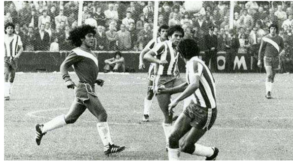
Maradona en su debut con 15 años.

Diego Armando Maradona es una de las figuras de los Mundiales, pero su actuación en el Mundial de 1986 llegó cuando ya tenía 25 años. A pesar de eso, debutó en la Liga Profesional Argentina el 20 de octubre de 1976 siendo un joven de apenas 15 años de edad, en un