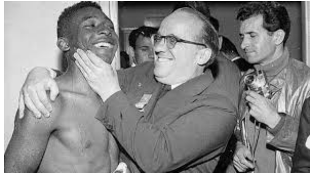
Pelé en el Mundial de 1958.

En el mundo del fútbol, aunque la experiencia sea un grado, los jóvenes siempre han tenido un papel importante, como en el Mundial de 1958 celebrado en Suecia. En aquel campeonato del mundo de selecciones, Edson Arantes do