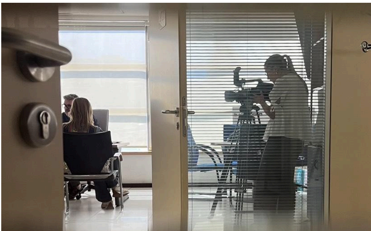
Grabación de imágenes de recurso