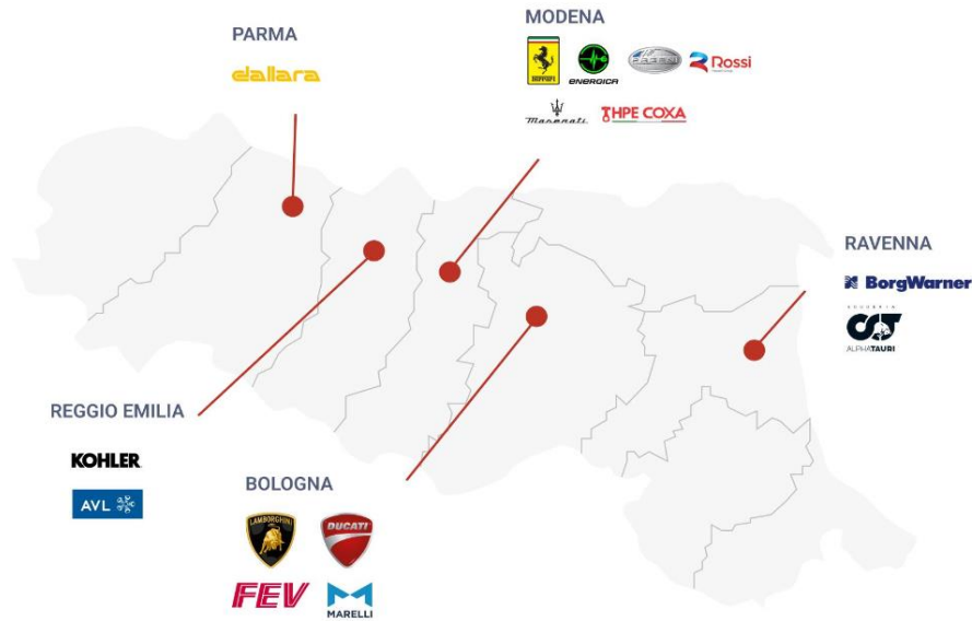
Figura 4. Mapa del Valle del Motor en Emilia – Romaña.

Como se puede ver en la figura 4, este valle comprende la producción de las piezas mecánicas, motores, automóviles y motocicletas de Ferrari, Lamborghini, Maserati, Pagani, Dallara, Ducati y Scuderia Alpha Turi, entre otros.