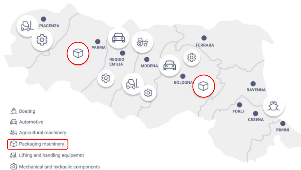
Figura 3. Mapa de las provincias que conforman "The Packaging Valley".

Es por tanto, uno de los principales valles de la región que ofrece ventajas y complementa a los demás valles, gracias a la presencia de las siguientes empresas y marcas regionales: IMA, Coesia, Tetra Park, Aetna Group, Sacmi, entre otras. En la figura 3 se pueden ver las provincias que conforman este clúster.