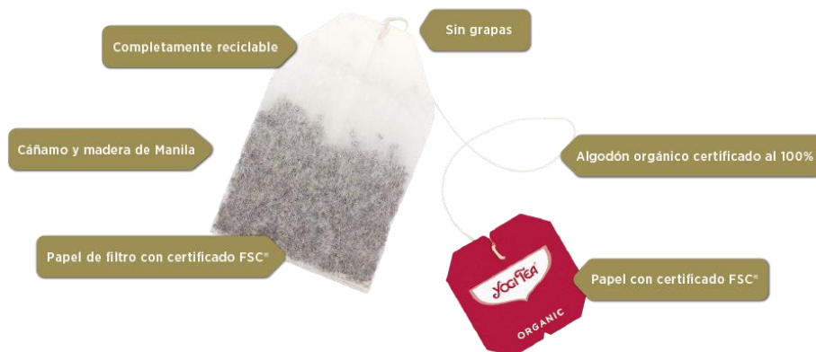
Figura 2. Bolsa de YOGI TEA®, ejemplo de producción del Valle del Empaquetado y del Embalaje.

En el día a día un ejemplo de este acto sería el consumo de YOGI TEA® (figura 2), pues en la ciudad de Imola, perteneciente al Valle del Embalaje y el Empaquetado se producen las bolsas que contienen sus infusiones y tés.