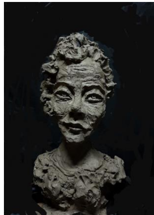
Figuras 6 "Druath"

Esta técnica tiene su origen en las antiguas civilizaciones de Grecia y Roma, además la manera en la que se realizaba no ha variado demasiado. Autores como Lluís Garriga utilizan la arcilla poder crear diferentes esculturas.