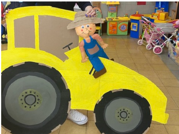
Anexo 1. Personaje que representa el proyecto hacerlo más interactivo