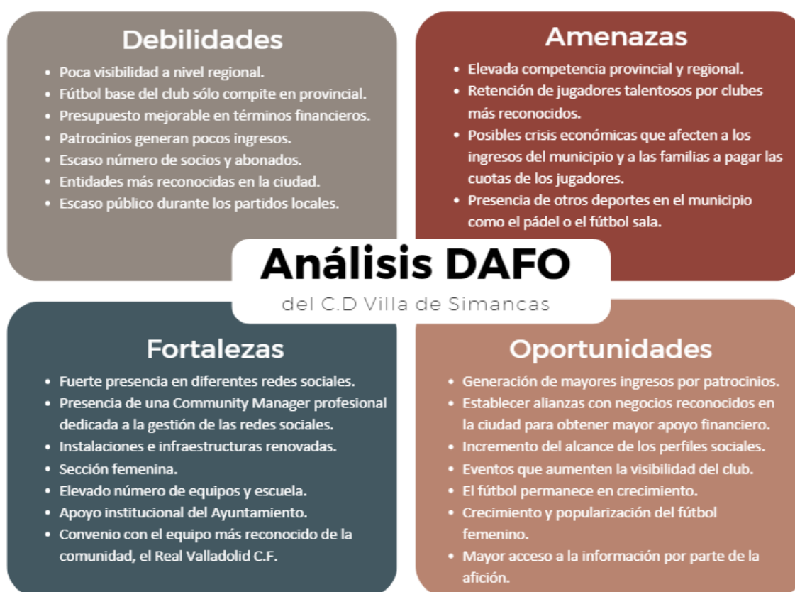
Tabla 5: Análisis DAFO del Villa de Simancas

Para realizar un diagnóstico de las situaciones externa e interna se ha llevado a cabo un análisis DAFO del Villa de Simancas mediante el cual se han tratado de identificar, por un lado, las fortalezas y debilidades (diagnóstico interno) y, por otro lado, las oportunidades y amenazas (diagnóstico externo) del club.