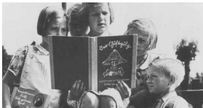
Imagen 14: La Seta Venenosa y la pedagogía nazi.

El poema compara al judío con el diablo, el cual aparece en Alemania como una plaga (plaga de judíos). Continúa hablando de su eliminación como la manera para ser felices. Para ello necesita del apoyo de la juventud (la cual sabemos que se adoctrina en la escuela y hasta ser mayores de edad, pasando por diferentes asociaciones juveniles) y así podrán eliminar al demonio (judío). Es un claro ejemplo de el adoctrinamiento de odio a los judíos que se planteaba en las escuelas.