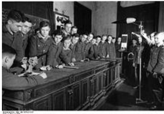
Imagen 15: Napola

Los “Centros de Educación Político-Nacional” o Napola , se trata de internados para adolescentes de entre diez y dieciocho años, quienes son preparados para futuros jefes de la SS, SA y policía. La organización de los estudios es igual que en los liceos, pero se ahonda más en el aprendizaje de la tradición popular alemana, la enseñanza de la herencia y las razas, la educación del cuerpo por la práctica del deporte y ejercicios militares. El examen final da acceso a la Universidad.