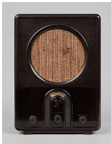
Imagen 4: Radio Volksempfänger VE 301 w.

Mediante estas herramientas el régimen pudo mantener el control de la sociedad. La influencia llegó a ser tal que la percepción y las ideas de la población quedaron resumidas a aquello que se retransmitía en los medios de comunicación.