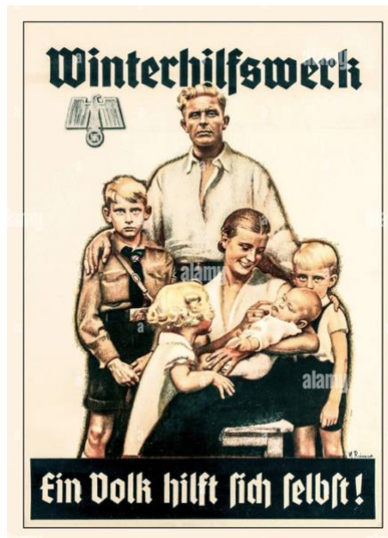
Imagen 11: Publicidad sobre las familias numerosas.

La administración Nazi proporcionó beneficios a las ‘madres puras’ de la siguiente manera: