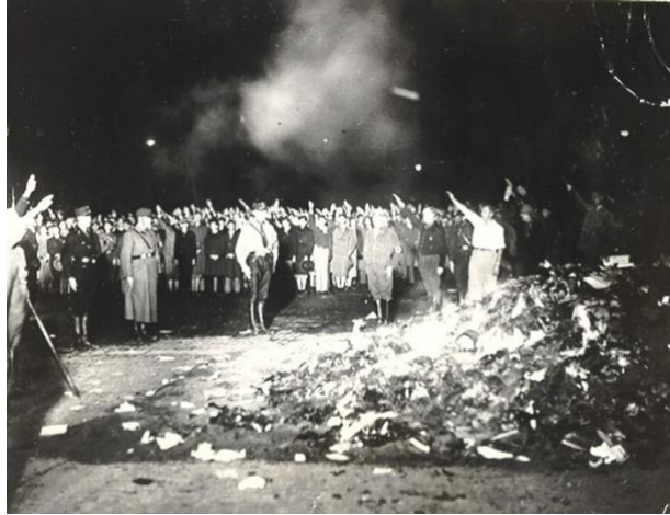
Imagen 7: La quema de libros de 1933 por parte de los nazis.

Esta situación da lugar a la creación de listas negras de autores, depuración de librerías y bibliotecas, purgas académicas e institucionales, etc. Promoviendo así una única cultura del pueblo la cual tuviese fuentes inspiradoras al gusto de las masas.