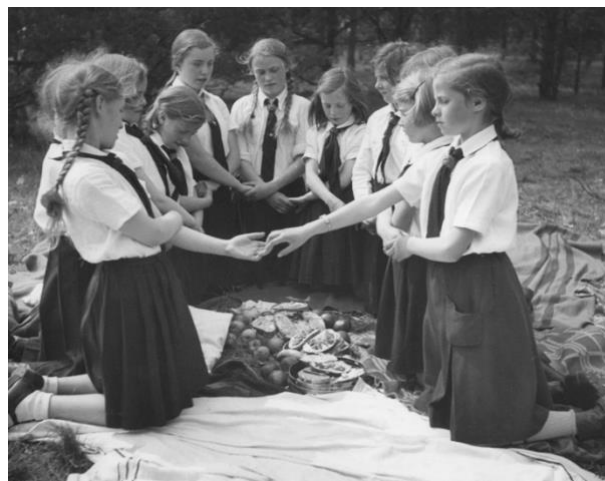
Imagen 19: Las niñas del “Jungmädelbund”

Al igual que los “Pimpf”, las “Jungmädel” eran las niñas pertenecientes a la asociación hasta los 14 años. En este, las chicas debían acudir regularmente a reuniones, competiciones deportivas, campamentos, etc. Tenían gran importancia las habilidades relacionadas con los viajes y faenas de albergue. (Grunberger, 2016, p. 295-296).