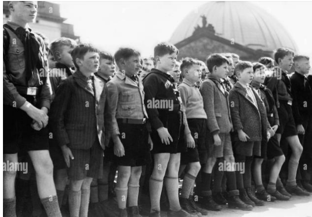
Imagen 18: Aceptación en el Deutsches Jungvolk, 1936.