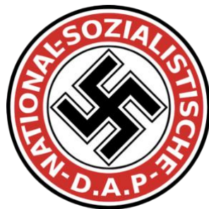
Imagen 1: Logotipo del Partido Nacionalsocialista Obrero Alemán (Nationalsozialistische Deutsche Arbeiter Partei, NSDAP).

El Partido Nacionalsocialista Obrero Alemán (NSDAP), con Adolf Hitler como líder, se convierte en único partido legal del Estado. La Ley contra la constitución de nuevos partidos del 14 de julio de 1933, dice que: “el Partido Nacionalsocialista de los Trabajadores de Alemania es el único partido en Alemania” ; a la vez que criminaliza cualquier actividad política partidista: “todo aquel que emprenda el mantenimiento y organización de otro partido político o la formación de uno nuevo, será castigado a trabajos forzados durante más de tres años, o con prisión de seis meses a tres años, siempre que el acto no esté sujeto a penas mayores por otras disposiciones” . (Díez Espinosa, 2002, p.79).