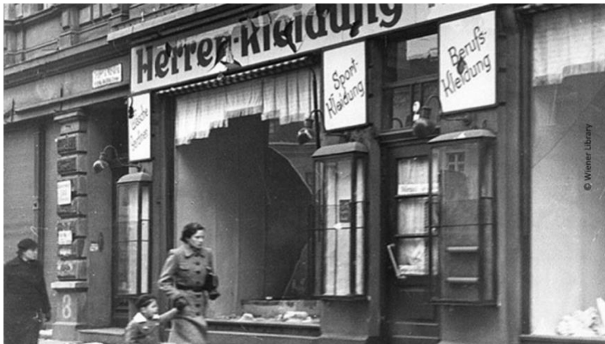
Imagen 8: La noche de los Cristales Rotos.

La exclusión de los judíos de Alemania dio comienzo con la llamada “Fase del 33” donde se sucedieron boicots a los establecimientos que poseían los judíos, destrozándolos y provocando el cierre de estos. esta situación empeora cuando se da la “Fase del 35” con las disposiciones de Nuremberg, la “Ley de la ciudadanía” y la “Ley de protección de la sangre y el honor alemán”. Poco después todos los funcionarios de origen judío son obligados a una jubilación forzosa. En 1938 se produjo la llamada “Noche de los cristales rotos” o Kristallnacht en la que comandos de las SA destruyeron numerosas sinagogas, viviendas y comercios.