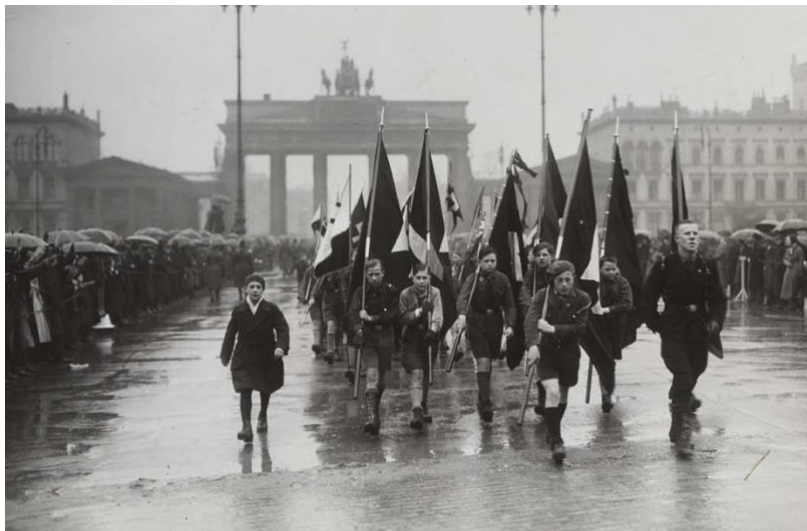
Imagen 2: Marcha propagandística de las Juventudes Hitlerianas, 1933.