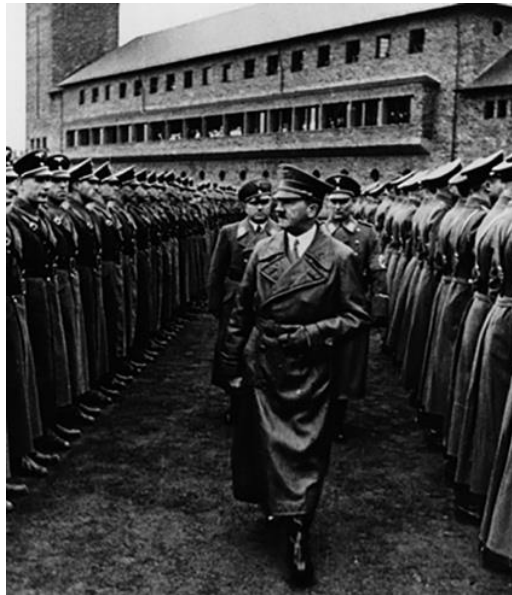
Imagen 17: El castillo de Hitler, el 'resort' donde se formaba la 'orden de caballeros' de la élite nazi.

Los “ Castillos de la Orden ”, tienen la misión de la formación de élites entre los adultos de 25 a 30 años.