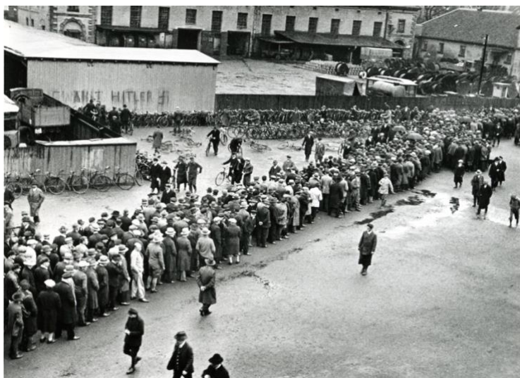
Imagen 9: Cola de desempleados en el patio de la oficina de empleo de Hannover, 1932.

El desempleo disminuyó notablemente pasando de 5,6 millones en el año 1932 a 0,4 millones en 1938.