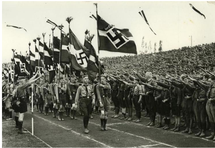
Imagen 20: Marcha de las Juventudes Hitlerianas en el Estadio alemán, 1936.

mapas, entre otras. También el ejercicio físico era fundamental para mantener un buen estado de salud.