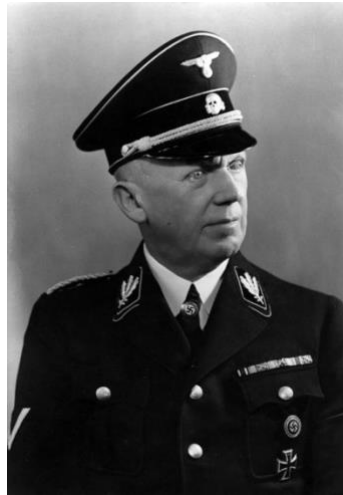
Imagen 5: Uniforme de las SS en 1938.

El control de la sociedad se consiguió también con la creación de una simbología propia del régimen que aunaba a toda la sociedad y a todos los movimientos. Se basaba en el uso de uniformes, banderas, pines y más accesorios, todos marcados con esvásticas.