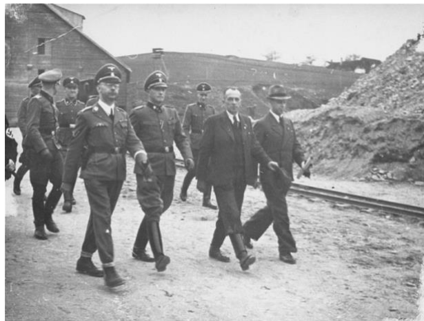
Imagen 6: Las SS y el sistema de campos.

La población cumple también un papel fundamental en este aspecto, tal como enuncia Díez Espinosa (2002), el Tercer Reich se convierte en una sociedad que se observa y vigila a sí misma. Tal fue el aumento de la desconfianza entre la población hace que aumente notablemente la denuncia, hasta tal punto que las cárceles se quedan sin hueco. Fue en marzo de 1933 cuando se crea el primer campo de concentración, allí fueron enviadas todas las personas que se consideraban un peligro para el Estado. Poco tiempo después las SS se hacen cargo de los campos de concentración, multiplicándolos en muy poco tiempo.