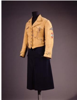
Imagen 22: Traje federal del BDM con insignia regional " Südost Oberdonau"