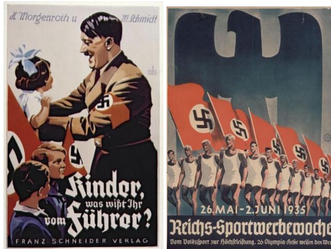
Imagen 3: Ejemplos de propaganda durante la Alemania nazi.

Existía también propaganda en las revistas y libros, en los que se reescribía la historia siempre de acuerdo con la ideología nazi.