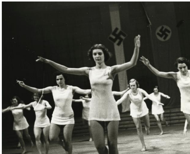
Imagen 23: Obra BDM "Fe y Belleza", 1939.

En 1938 a las ligas femeninas Jungmädelsbund y BDM se añadió una nueva sección llamada "Fe y Belleza" ( "Glaube und Schönheit" ) dirigida a mujeres de entre 17 y 21 años que promovían las condiciones físicas de las mujeres mediante deportes, actividades del hogar y la maternidad.