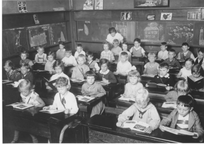
Imagen 16: Aula de las Escuelas de Adolf Hitler.

Los “ Castillos de la Orden ”, tienen la misión de la formación de élites entre los adultos de 25 a 30 años.