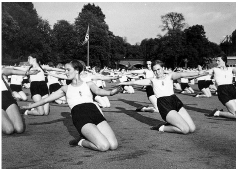
Imagen 21: Festival deportivo de la BDM

- Liga de Niñas Alemanas ( Bund Deutscher Mädel o BDM ) para niñas de 14 a 18 años. La BDM fue fundada en el año 1930, destinada a las mujeres de entre 14 y 18 años. Pretendía formar a las jóvenes desde edades tempranas en programas deportivos, cuidado de su salud, disciplina, sacrificio y control corporal.