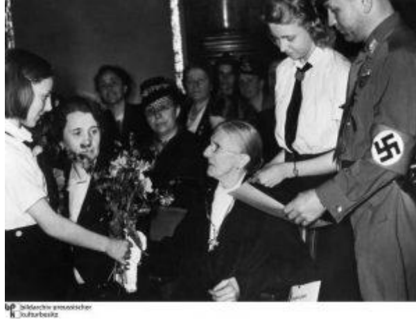
Imagen 10: Mutterkreuz : Cruz de Honor a la Madre Alemana.

Las madres podían llegar a ser galardonadas con la Cruz de Honor de la Madre Alemana. No obstante, para recibir estas compensaciones, las familias debían de cumplir unos requisitos, se descartaba a las mujeres viudas, solteras o divorciadas (Diez Espinosa, 2009).