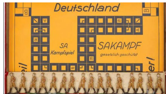
Ilustración 12, Juego con ideología nazi.

Los nazis alimentaron tanto el hambre bélico de los niños y las juventudes que los juegos consistían en competir con armas en miniatura para poder conquistar la tierra enemiga y limpiar el país (tablero) de los judíos indeseables, como ellos les consideraban.