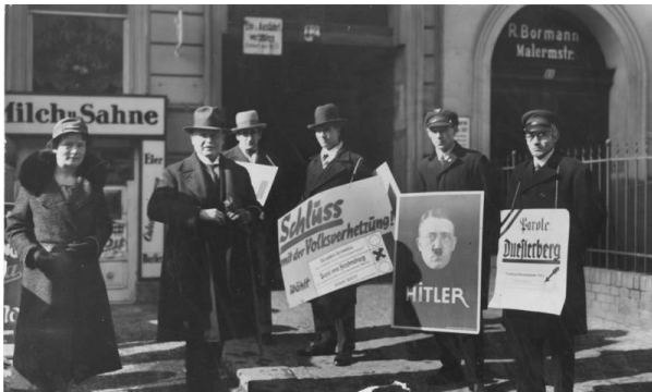
Ilustración 1. Personas saliendo del colegio electoral, oficialmente los nazis están en el poder.

Fue, entonces, en 1933, cuando Hitler subió al poder tras ser nombrado canciller. El poder nazi se hizo indiscutible, ejemplo de ello fue la Noche de los Cuchillos Largos en 1934, donde por orden de Hitler se asesinaron a muchos dirigentes de las SA además de otros líderes políticos.