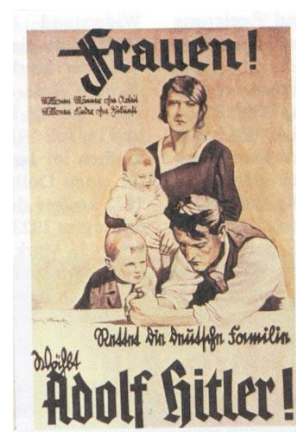
Ilustración 15. Cartel propagandístico pronatalista

Los matrimonios entre los alemanes debían ser siempre formados por dos personas de raza aria, el matrimonio con una persona de otra raza o etnia sería prohibido ya que sino no se conseguiría el objetivo del Führer de crear una sociedad “pura”.