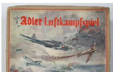
Ilustración 13. Juego de batallas aéreas de 1941.

Estos medios de entretenimiento se hacen eco de la ideología que también se trataba en los colegios, pero sobre todo los juegos tridimensionales eran tan manipulativos que hacían que los jóvenes incrementasen su imaginación, basada en la animadversión a las razas que no eran la alemana.