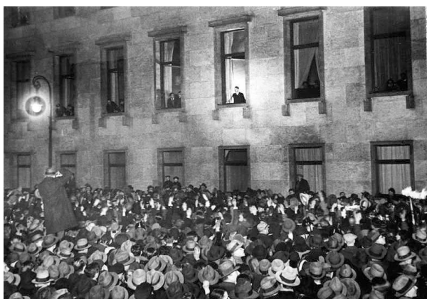
Ilustración 3. Hitler, recién nombrado canceller saluda a la multitud.

“El Estado exige a este particular, bajo terribles amenazas, que renuncie a sus amigos, que abandone a sus novias, que deje a un lado sus convicciones y acepte otras preestablecidas, que salude de forma distinta a la que está acostumbrado, que coma y beba de forma distinta a la que le gusta, que dedique su tiempo libre a ocupaciones que detesta, que ponga su persona a disposición de aventuras que rechaza, que niegue su pasado y su propio yo, y en especial, que, al hacer todo ello, muestre continuamente un entusiasmo y agradecimientos máximos” (Haffner, 2001, pp.11-12 como se cita en Grunberger, 2011, p.84)