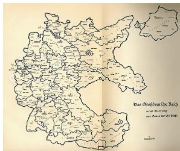
Ilustración 4. División política de una ciudad alemana.

Cada uno de estos distritos, a su vez recogía otra serie de distritos o localidades más pequeñas e incluso pertenecían a ellos los Blocke que eran los bloques de edificios de cada manzana o barrio.