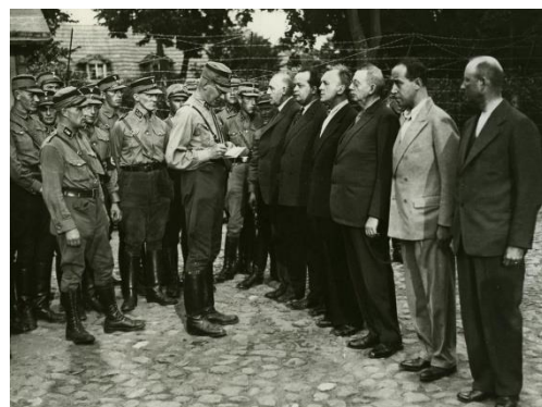
Ilustración 7. Opositores al régimen llevados a campos de concentración.

Estos lugares eran recintos cerrados herméticamente sin posibilidad alguna de escapar si no muerto.