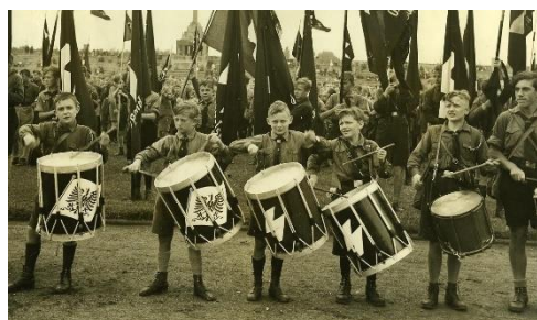
Ilustración 8. Juventudes Hitlerianas en 1933

Además, los niños, niñas y jóvenes pertenecerían, ya como única organización, a las Juventudes Hitlerianas.