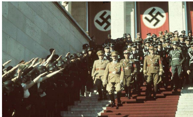
Ilustración 2. Hitler acompañado de otros funcionarios del partido nazi

Será desde este momento cuando Hitler utiliza el poder que se le ha otorgado para recurrir a la Constitución de 1919 para “la destrucción del régimen constitucional a través de la vía constitucional misma” (Díez Espinosa, 2007, p.74).