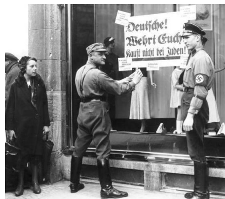
Ilustración 9. Soldado nazi pone un cartel en el escaparate de una tienda judía para identificarla y no comprar allí.

Esta privación del judío a llevar una vida normal se completa en 1938, cuando, por último, se les expulsará del ámbito económico pidiendo al judío que declare todo patrimonio que tenga y que sea superior a cinco mil marcos para, más tarde, confiscarlo.