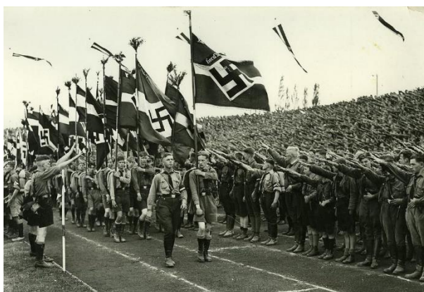
Ilustración 14. Juventudes Hitlerianas en un mitin.

Estos chicos y niños no tenían otra alternativa que seguir a Hitler, era a quien habían votado sus mayores, por lo tanto, aunque no quisieran seguir el ideario nazi en un principio deberían acatarlo.