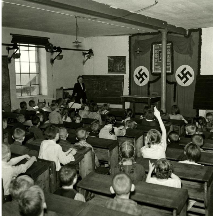
Ilustración 11. Aula alemana 1940

Los nazis alimentaron tanto el hambre bélico de los niños y las juventudes que los juegos consistían en competir con armas en miniatura para poder conquistar la tierra enemiga y limpiar el país (tablero) de los judíos indeseables, como ellos les consideraban.