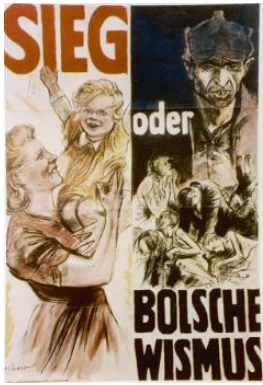
Ilustración 6. Anima a decidir a favor del nazismo.

La propaganda era una red de cables que cubría todo el país, es decir, mediante los carteles, obras cinematográficas y otros muchos recursos que se expandieron se hacía llegar los ideales del nacionalsocialismo a todos los lugares de Alemania.