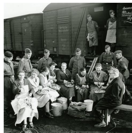
Ilustración 5. Asociación de mujeres con soldados de batería antiaérea.

Toda persona alemana debe hacer caso omiso a aquello que el partido dicte ya que tiene supremacía sobre cualquier organismo. Los padres ya no son una imagen de autoridad, sino que los hijos pueden recurrir al partido como método de defensa.