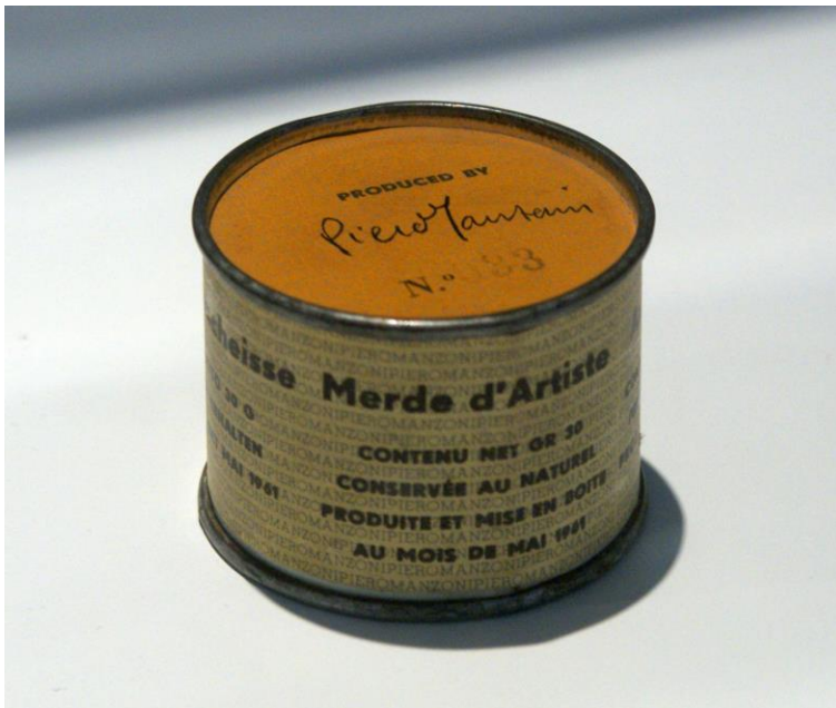
Merde d'artista . Piero Manzoni.