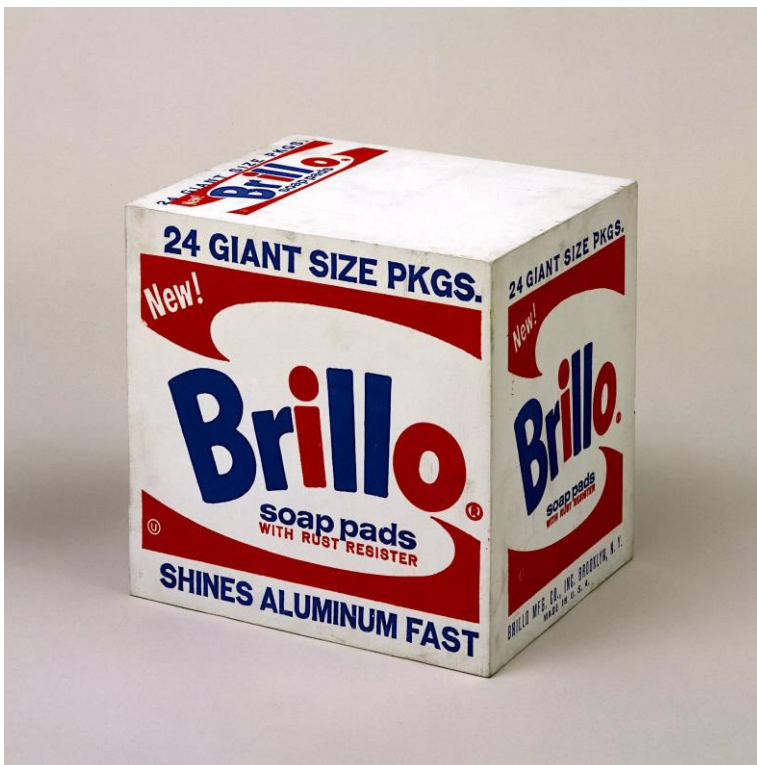
Caja Brillo. Andy Warhol.