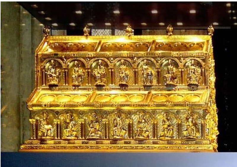
Relicario de los tres magos de la catedral de Colonia. Nicolás de Verdún.