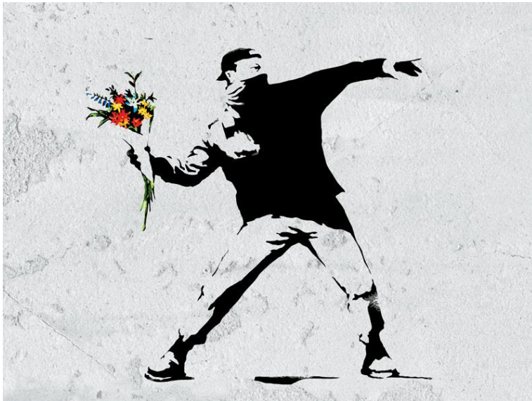
Flower Thrower. Banksy.