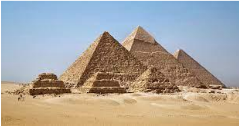
Pirámides de Giza.