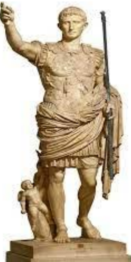
Augusto Prima Porta.