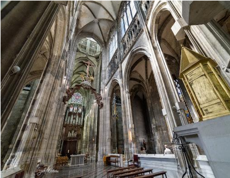
Iglesia de Saint-Maclou. Rouen.