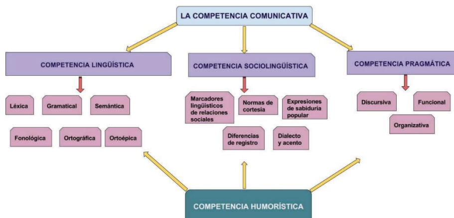
Esquema 3. La competencia humorística y su influjo sobre la competencia comunicativa (Linares Bernabéu, 2017, p. 206)

Por otro lado, Aguirre (2005) categoriza la competencia comunicativa en tres dimensiones: Una cognitiva, una comunicativa y una sociocultural. En línea con este pensamiento, Niño (2008) describe esta competencia como un ejercicio de comprensión de los conocimientos, actitudes y valores que orbitan en torno a un contexto comunicativo determinado para realizar actos comunicativos que, siguiendo ciertos criterios, nos permiten expresarnos de manera eficiente según nuestros propósitos. (Bermúdez & González 2011, pp. 3-5) A este respecto, Linares Bernabéu (2017, p. 206) justifica por qué la competencia humorística incide en la conformación de la competencia comunicativa. La autora explica que el desarrollo de la competencia humorística en los estudiantes de ELE precisa de tener un cierto conocimiento lingüístico, la capacidad de estructurar adecuadamente un discurso a un contexto —refiriéndose a una capacidad pragmática o cognitiva— y la capacitación para involucrarse en contexto social del uso de la lengua.