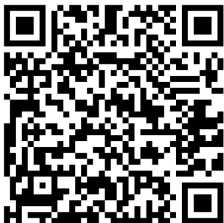
Ilustración 6. Modo Discovery. Agricultura. Elaboración propia.