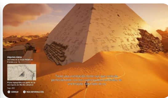
Ilustración 2. Assassin's Creed: Origins (Ubisoft, 2017). Modo Discovery.

Durante la propuesta, se realizarán distintas actividades, tanto para recoger y sintetizar información, llevar a la práctica lo aprendido y reflexivas, donde el alumnado deberá construir sus propias ideas y conclusiones. Además, la mayor parte del tiempo los estudiantes trabajarán en pequeños grupos, fomentando de esta forma el trabajo en equipo y cooperativo.