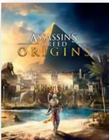
Ilustración 1 Portada Assassin's Creed: Origins (Ubisoft, 2017)

Debido a los motivos expuestos anteriormente es por lo que esta propuesta de intervención será realizada en torno a los videojuegos, más en concreto, del videojuego Assassin's Creed: Origins (Ubisoft, 2017)