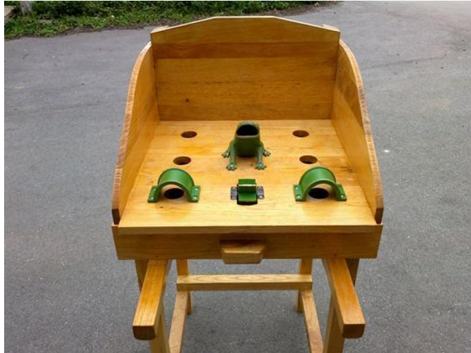
Deportes Autóctonos de Castilla y León (2016)

Las dimensiones de la mesa serán: altura de 80 a 90cm, anchura y longitud de 50cm cada una y la pista de juego tiene que tener 7n metros de largo y 2m de ancho.