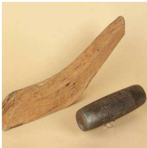
Deportes Autóctonos de Castilla y León (2016)