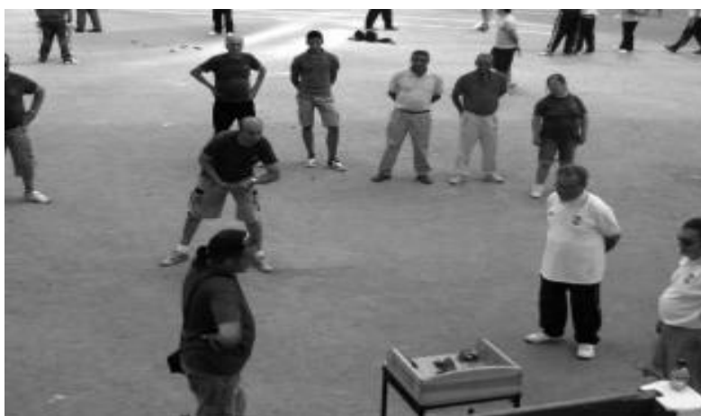
Deportes Autóctonos de Castilla y León (2016)

Es un juego que se remonta a la antigüedad. Tiene su origen en los egipcios y los romanos, siendo estos últimos los que introdujeron esta variante inicial en la península. Este juego ha ido evolucionando a lo largo de la historia hasta llegar a ser un deporte determinado por una serie de normas y reglas. En los años 50 o 60 era muy habitual que el juego de la rana estuviera presente en los bares o tabernas para que los clientes pudieran pasar un rato agradable y entretenido jugando a dicho juego. Por otra parte, era un juego en el que los clientes podían apostarse dinero o consumiciones dentro del bar.