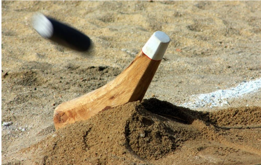
Deportes Autóctonos de Castilla y León (2016)