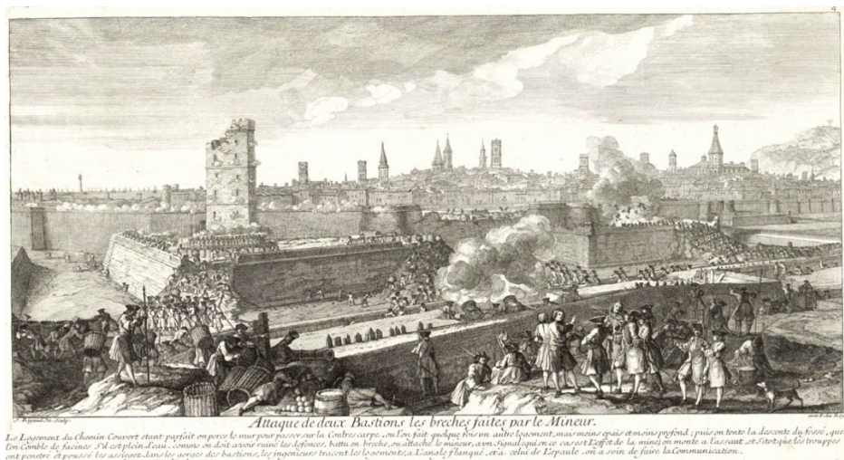
Figura 5. Ataque de deux bastions les breches faites par le mineur.