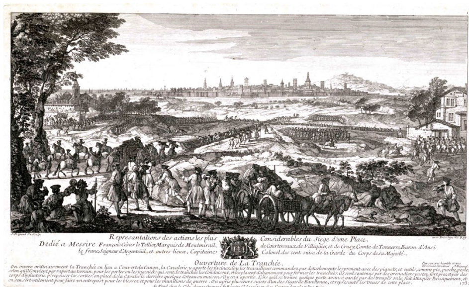
Figura 2. Ouverture de la tranchée.

La ciudad que representa Rigaud está inspirada en Barcelona, pero da demasiadas licencias a la imaginación. La descripción de las murallas es bastante correcta; puede constatarse la pervivencia de la base de las torres medievales, y se distinguen los supuestos baluartes de Jonquieres, Sant Pere, Portal Nou y Santa Clara 42 . La distancia que otorga a la cortina existente entre el baluarte de Portal Nou y el de Santa Clara es excesivamente corta, es un error que, voluntariamente o no, se mantiene en las sucesivas visiones del sitio. De hecho, la distancia entre ambos baluartes sobrepasaba los 350 metros. Esta zona vulnerable de las defensas fue la que eligió Berwick para expugnar la ciudad. En los siguientes grabados la imagen se focaliza cada vez más en el espacio definido entre los baluartes de Santa Clara y Portal Nou.