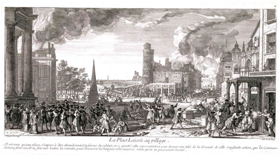
Figura 7. La place laissée au pillage.

sucedió en Barcelona: una capitulación pactada que salvó la ciudad del saqueo. En los primeros días que siguieron a la rendición, ni las personas ni sus propiedades fueron violentadas. Sin embargo, la serie de láminas de Rigaud, con una finalidad didáctica, explican que es lo que le ocurre a una ciudad que opta por oponerse al rey: el saqueo y la destrucción. En la zona central del dibujo, la soldadesca ejerce la violencia contra los habitantes de la ciudad. Los soldados se dedican al pillaje, disparan y acuchillan a la gente, violan a las mujeres, y los incendios consumen casas y palacios. Sin embargo, el texto y la ilustración explican que los generosos comandantes vencedores ponen freno a los excesos. En el caso de Barcelona Felipe V había dado órdenes a Berwick para que saqueara y destruyera la ciudad. Berwick, ciertamente, estaba dispuesto a arrasarse Barcelona, sin embargo, la dura resistencia, y la incertidumbre que tal situación implicaba, le hizo cambiar de opinión y optó por negociar la capitulación. La zona representada en el grabado no se corresponde a ningún lugar identificable de Barcelona, parece que quiere evocar un lugar cercano al puerto que se representa desde una visual en posición inversa a la que tenía en realidad, y recuerda algunas de las imágenes que Rigaud utilizó en los grabados del puerto de Marsella.