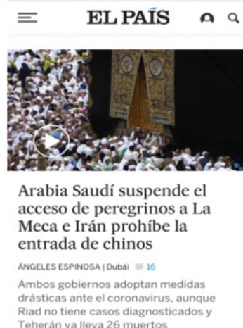
Capturas imágenes 1 y 2. Portada digital El País (tomadas el 27 de febrero de 2020).