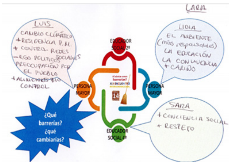
Figura 3. ¿Qué cambiarías? Intercambios dialógicos entre jóvenes y mayores.

En uno de estos encuentros, durante un diálogo para tratar de indagar qué aspectos de la sociedad merecerían un cambio, los conceptos “violencia” (de género, relacionada con la inseguridad ciudadana, con las guerras...) y “desigualdades” son los que más se repitieron (figura 3).