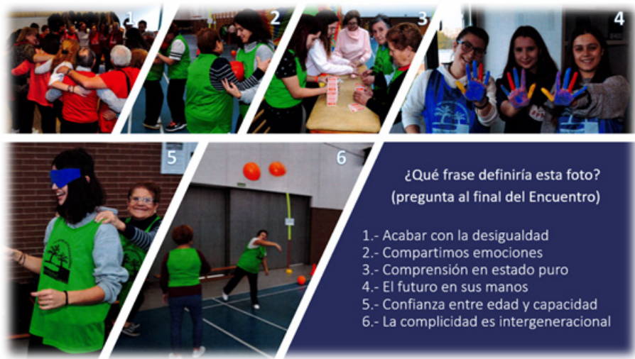
Figura 4. Imágenes para la reflexión y evaluación del encuentro.

Al final de aquella jornada, como parte de la evaluación, se recogieron las percepciones y emociones que se habían movilizado hasta aupar a un primer puesto la valoración del vínculo conseguido mediante la convivencia y el afecto. Parece fundamental romper barreras a través de la educación social y la puesta en práctica de habilidades como la empatía. Ayudados de alguna fotografía con imágenes de lo acontecido durante la jornada (Figura 4), se trató de definir las impresiones finales en términos de complicidad, depositando toda la confianza en un futuro posible en donde no haya lugar para las desigualdades.