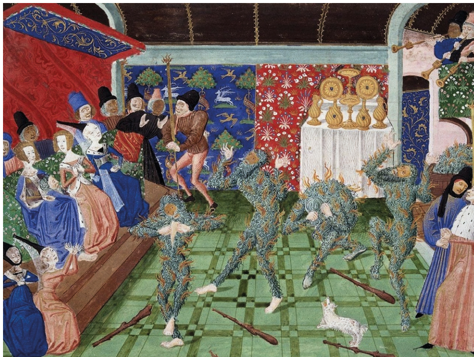
Figura 7. Crónicas de Jean Froissart. Le Bal des Ardents . Miniatura Philippe de Mazerolles, ca. 1470/1472 British Library. Harley 4380

La ficción amorosa de este tipo de textos (a diferencia de lo que sucede en los libros de caballerías en los que es el caballero/guerrero el gran protagonista) desgrana un ideario en el que la dama, por encima del caballero, es la poseedora de un ramillete de altas virtudes. 30 En este sentido, la existencia de la dama determina la del caballero quien recupera su identidad gracias a ella, reproduciéndose a través de la relación de ambos dama/caballero el reflejo especular de la habida entre señor/vasallo.