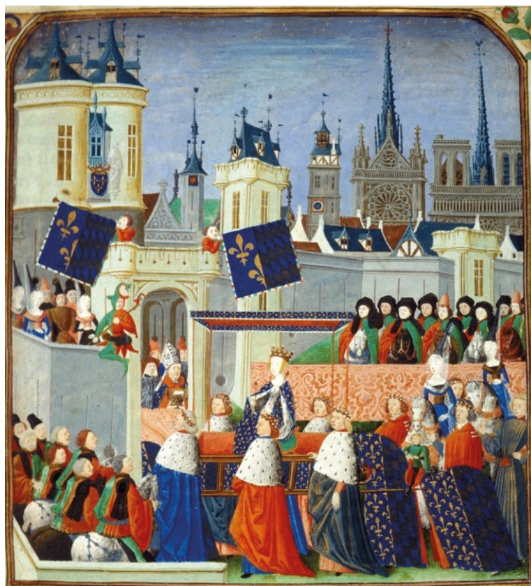
Figura 1. Crónicas de Jean Froissart. Entrada de la reina Isabel de Baviera en París en 1389. Miniatura ca. 1470/1472. BL Harley 4379. British Library (Inglaterra)

Un modelo que podría definirse como arte total , idóneo para ensalzar entradas en las ciudades, actos litúrgicos, funerales, bautizos, coronaciones y todo tipo de acontecimientos en los que, de forma sutil, habían de simbolizarse las relaciones del poder [fig. 1]. Un todo, en el que el espectador era sujeto en interacción, que cualificaba un espacio de frontera entre la realidad y la ficción. Una complejidad ambigua que alcanzó su plenitud en la fiesta, al ser esta una experiencia ceremonial con ciertos ribetes herméticos, que buscaba la recreación consciente de una especie de «Reino de la Gracia» alumbrado por el buen gobierno del «Príncipe» y los frutos derivados de este.