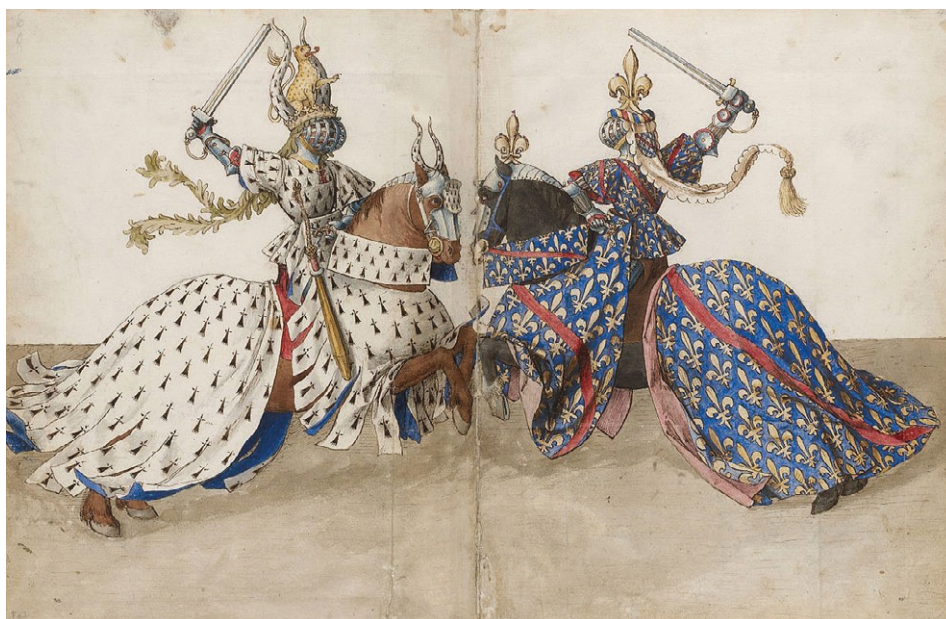
Figura 3. Libro de los torneos. Los duques de Bretaña y Borbón armados a caballo y con crestas como si estuvieran en el torneo. Biblioteca Nacional de Francia. Miniatura ca. 1460 de Barthélemy d'Eyck. Tinta lavada sobre papel

A comienzos del siglo XVI un grupo de textos, crónicas y diarios de viaje, recogen el singular viaje de aparato llevado a cabo por los archiduques de Austria que, partiendo de los Países Bajos, cruza Francia para llegar al corazón de Castilla: la ciudad imperial de Toledo. 7 A la luz de los contenidos expresados, llama la atención las diferentes fórmulas festivas desarrolladas a lo largo de dicho viaje [fig. 3]. No pueden pasarse por alto las justas que, para agasajo de los príncipes, fueron organizadas en Madrid el domingo 17 de abril, 8 o las que ofreció en Valladolid el Almirante de Castilla, a su vez, activo participante. 9 Pero, por encima de justas, juegos de cañas, entradas, misas, y otras celebraciones, lo que mayor sorpresa y «maravilla» causó entre los flamencos fue la cena banquete con la que el condestable de Castilla, Bernardino Fernández de Velasco, agasajó a los futuros príncipes.