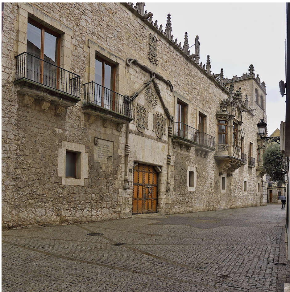
Figura 4. Fachada principal de la Casa del Cordón, Burgos .

misas y otros oficios litúrgicos, los príncipes fueron obsequiados con múltiples funciones entre las que se encontraban las fiestas de toros, los castillos de fuegos artificiales, los juegos de cañas y otros espectáculos dispuestos en la plaza del Mercado Nuevo, delante de la fachada principal del palacio. Para este fin, el condestable había hecho instalar, a la altura de las galerías, una tribuna que permitía a los príncipes asistir a las diversiones sin tener que sufrir la incómoda cercanía de las gentes. 15