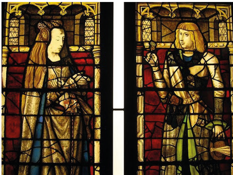
Figura 8. Juana I de Castilla y Felipe el Hermoso. Vidrieras de la Basílica de la Santa Sangre (siglo XIX, Inspiradas en los repertorios dinásticos que mostraban las vidrieras originales del siglo XV). Brujas, Bélgica.