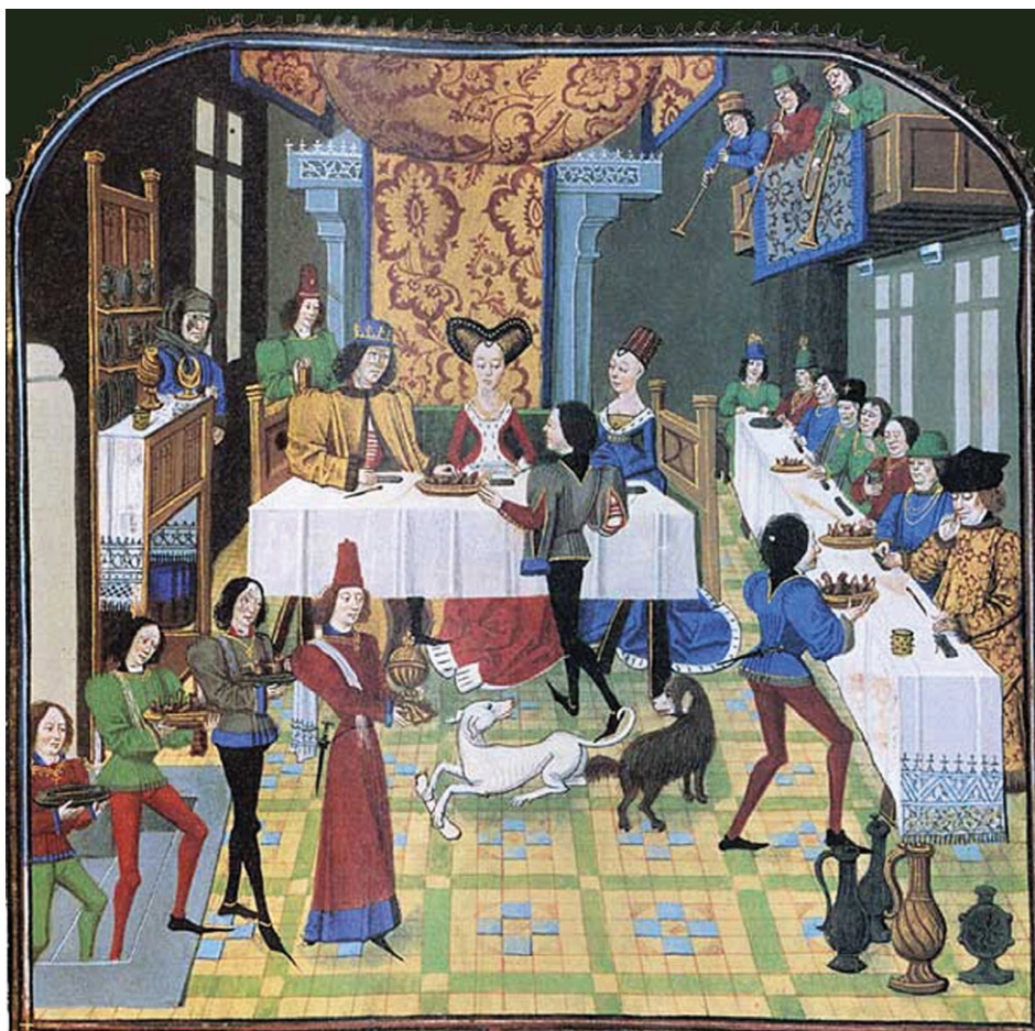
Figura 6. Histoire d'Olivier de Castille et d'Artus d'Algarbe . Banquete de bodas (fol. 181 V). Miniatura atrib. Loyset Liédet, ca. 1440 Bibliothèque Nationale de France. Français 12574

Y todo súbitamente fue arrostrada (subida) la dicha tapicería, y ellos vieron el dicho jardín. Y comenzó a aproximarse todo, movido por sutiles ingenios. Y había tres grandes ruedas más altas que el dicho jardín y esto fue la pera. 22