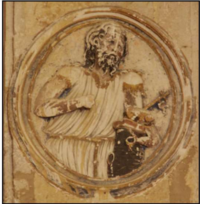
Fig. 4: Tondos de la capilla del obispo Alonso Manso.

Becerril vivía un auge económico que se traduciría en un desarrollo artístico nunca superado. De ahí que alguno de los maestros encargados de las distintas obras en los templos parroquiales de la villa se encargara de la cantería como el tándem Rodrigo Gil de Hontañón-Alonso de Pando o Juan de Escalante, cabezas de un amplio número de maestros activos entonces en Becerril 25 .