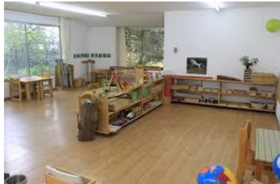
Aulas sistema Amara Berri: