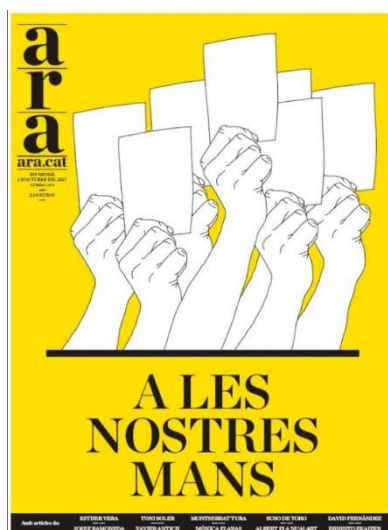
Figura 2. Imagen de Diari ARA, "En nuestras manos". Portada del 01/10/2017