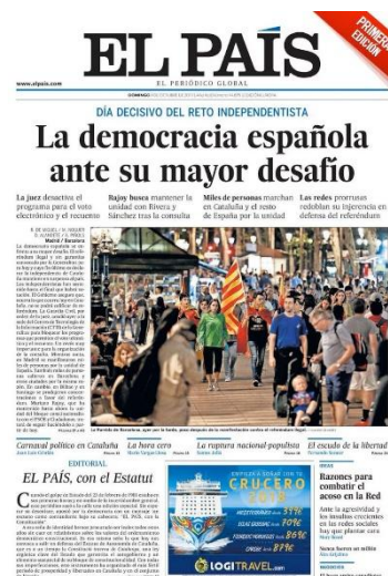
Figura 3. Imagen de El País, "La democracia ante su mayor desafío". Portada del 01/10/2017