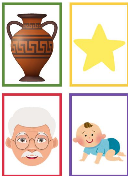
Imágenes 7-8-9: Tarjetas prueba Caída de Troya. Elaboración propia.