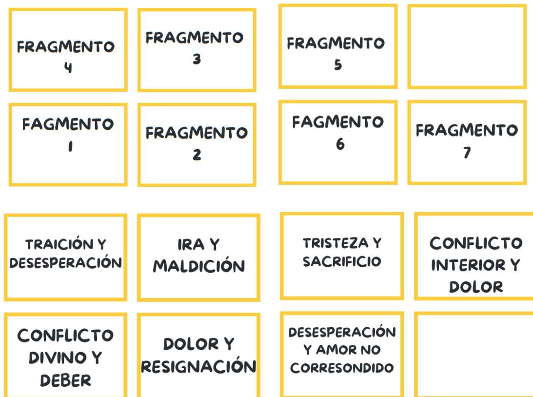
Imágenes 10-11-12-13: Tarjetas de emociones y fragmentos de lectura para emparejar.