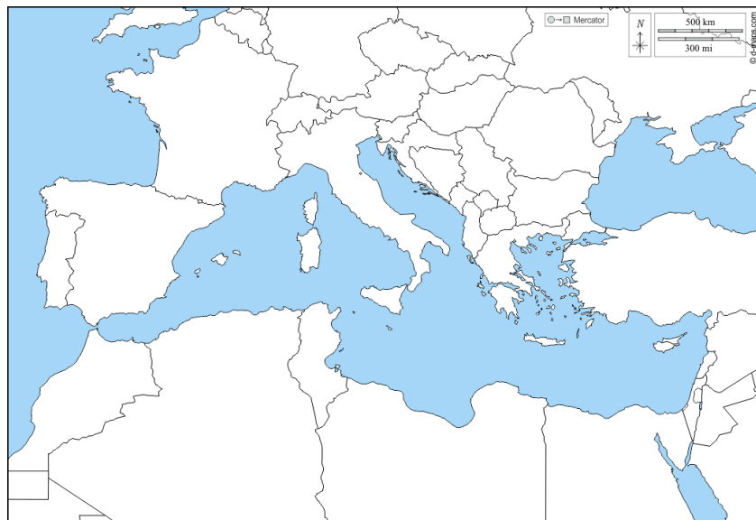
Imagen 17: Mapa del mediterráneo para reconstruir el viaje de Eneas.