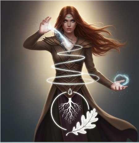
Imagen 23: Avatar del personaje. Generado con IA Gemini.