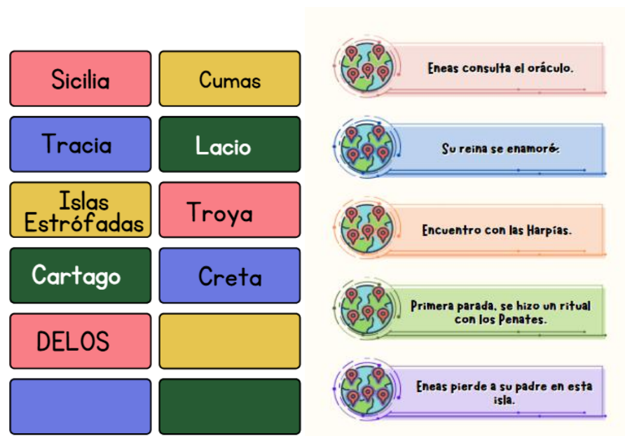
Imagen 18-19: Etiquetas de lugares y descripciones para completar el mapa. Creación propia.