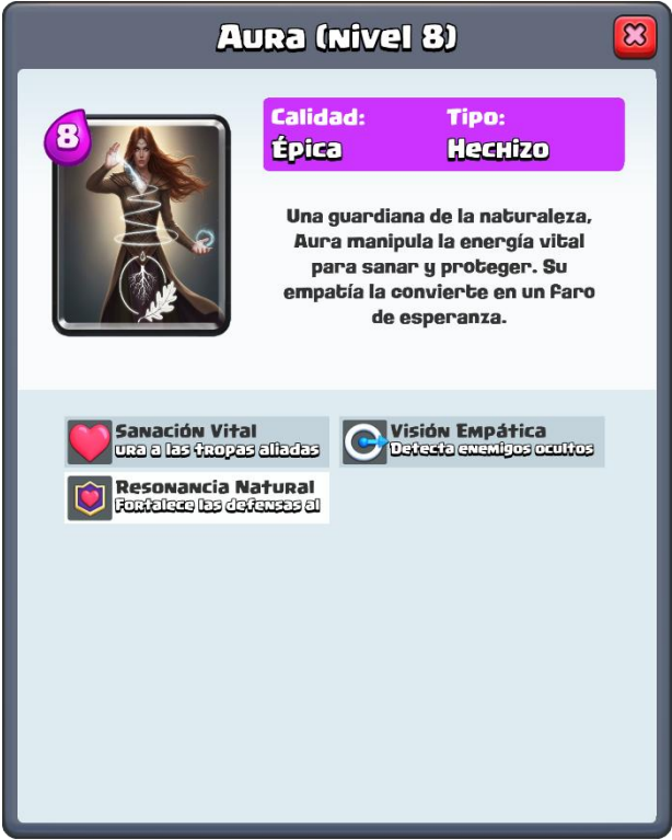
Imagen 22: Ejemplo de creación de héroe tipo Clash Royale.