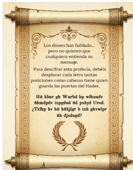
Imagen 6: Frase para código César.