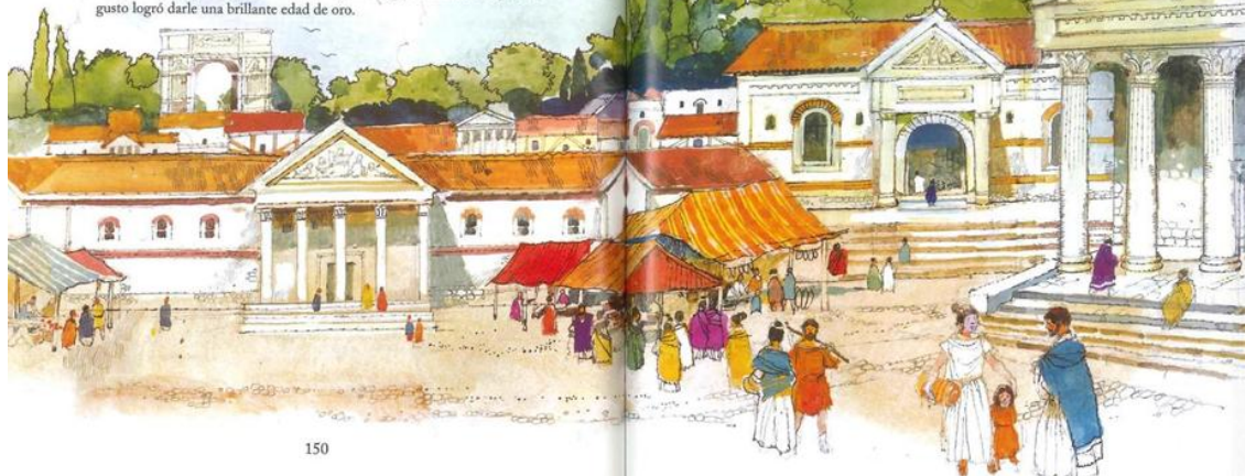
Imágenes 1-2-3-4: Fragmentos de texto adaptado para lectura.

Tras la muerte de Eneas, su hijo Ascanio fundó la ciudad de Alba Longa, muy cerca del lugar donde, con el tiempo, se levantaría la gloriosa Roma, patria de espléndidos monumentos y sabios gobernantes a la que Augusto logró darle una brillante edad de oro.