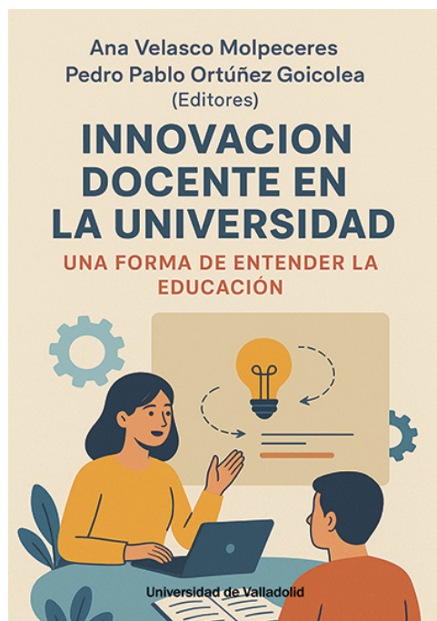
Figura 4. Volumen colectivo coordinado y desarrollado en el PID (Velasco Molpeceres y Ortúñez Goicolea, 2025). En acceso abierto: