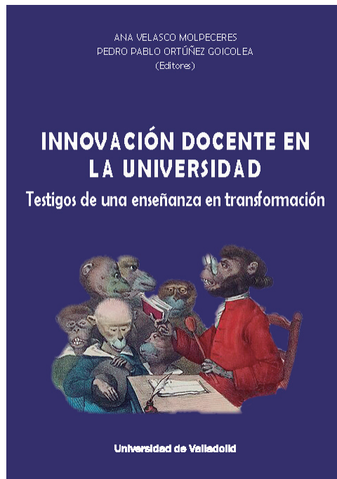
Figura 3. Volumen colectivo coordinado y desarrollado en el PID (Velasco Molpeceres y Ortúñez Goicolea, 2025). En acceso abierto: