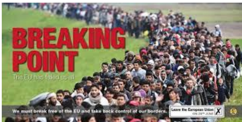
Imagen 2.

La polémica saltó en esta campaña por varios mensajes, uno de ellos fue por la utilización de un cartel por parte del UKIP por incitar al odio racial y que en las redes sociales fue comparada con imágenes reales en blanco y negro de un documental sobre la propaganda nazi emitido por la BBC en 2005. La imagen utilizada para el cartel, es una instantánea tomada en la frontera entre Croacia y Eslovenia en el 2015.