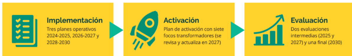
Ilustración 1 Sistema de implementación, seguimiento y evaluación de la estrategia estatal de cuidados (Gobierno de España)

En cuanto al sistema de implementación, seguimiento y evaluación que se ha seguido, se ha basado en un proceso cíclico que comienza con una planificación operativa y su implementación se irá retroalimentando en base a un proceso de seguimiento.