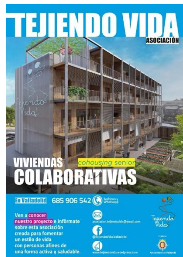
Ilustración 2 Cartel publicitario Tejiendo Vidas

En cuanto a su edificio, está formado por 27 apartamentos adaptados de 45 metros cuadrados y aproximadamente 1.000 metros cuadrados de espacios comunes.