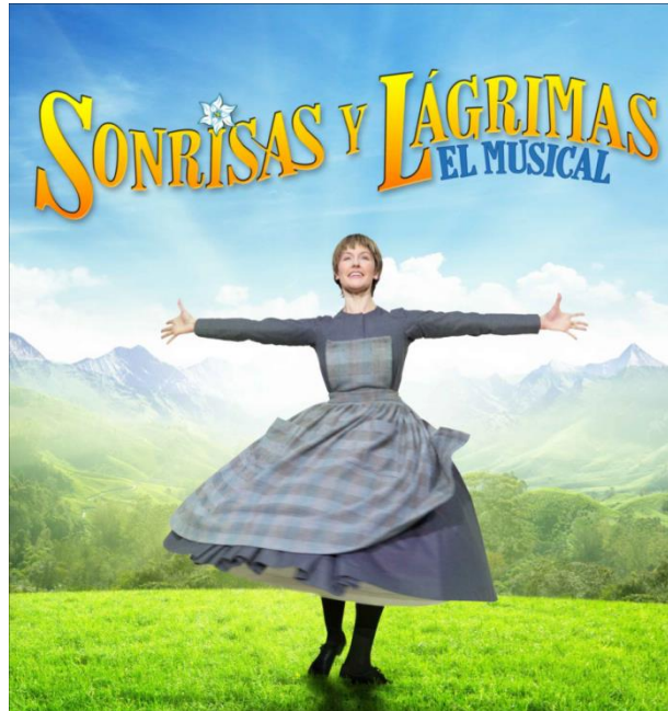
Sonrisas y lágrimas “el musical”