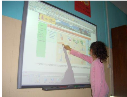
Figura 5: juegos dentro de las TIC

Estos juegos se van a poder llevar a cabo tanto de manera individual (cada niño en su propio ordenador) o de manera conjunta (en la pizarra digital).