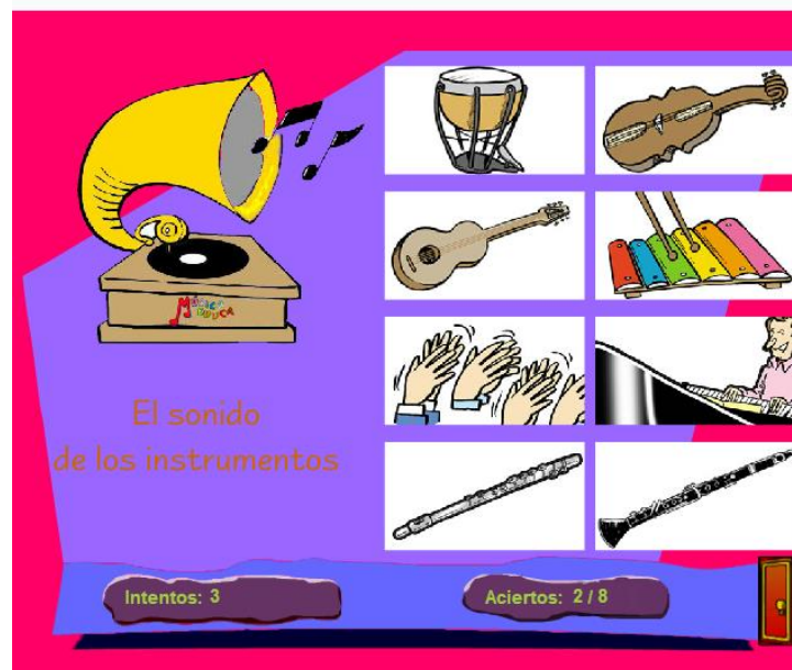
Juegos Musicaeduca “Adivina el instrumento que suena”