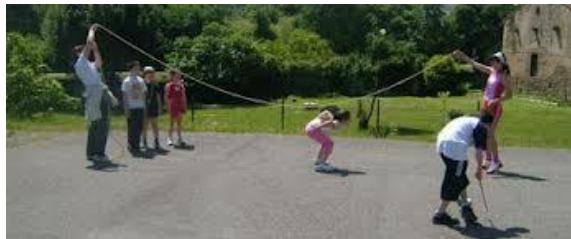
Figura 4: juegos de saltar a la comba

Aunque es más frecuente que las niñas salten a la comba, en nuestra época este tipo de juego ha sido practicado también por niños. Aunque la comba ha sido sustituida por la goma, se suelen utilizar las mismas canciones para una y para otra. Sin embargo, canciones tradicionales como Al pasar la barca o La reina de los mares están perdiendo su uso y, se cantan otras más modernas como El demonio como era travieso o Para bailar el twist .