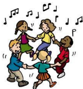
Figura 3: juegos de corro

puede adoptar variedad de criterios (según la posición, según los movimientos y la participación). Esto da lugar a múltiples variantes.