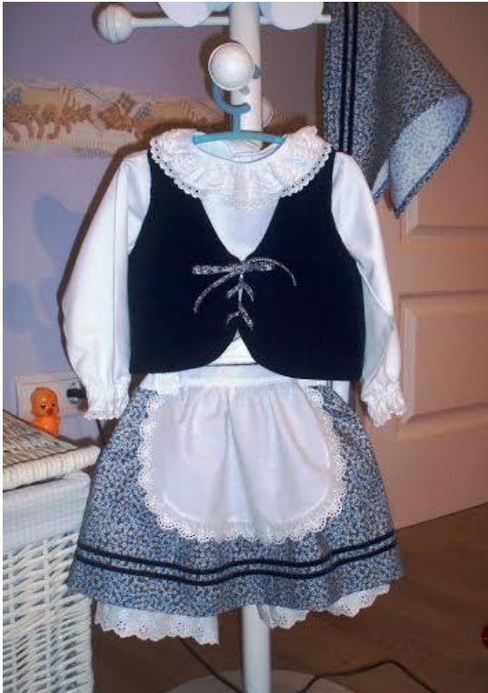
Traje de niña

Trajes de pastorcillo y pastorcilla ( http://www.disfracesymascaras.com/disfraz-de-pastora-con-patrones/ y http://losmodelitosdemama.blogspot.com.es/2011/01/pastores-venid-pastores-llegad.html?m=1%20y%20http://3.bp.blogspot.com/-cdeuaxrAEqA/TvRJFle5G4I/AAAAAAAAAFXs/wnpWxR8avuY/s1600/DSCF0023_picnik.jpg )