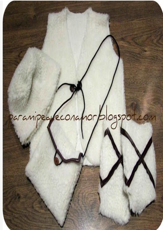
traje de niño