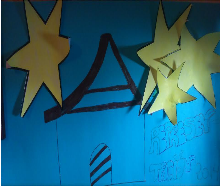
Ejemplo de uno de los decorados de la obra de teatro (realizado con cartulina)