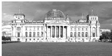
El Reichstag hoy.

En definitiva, no hemos pretendido hacer un análisis estilístico de las obras, sino una ruta histórica, de la mano del autor vallisoletano, que nos retrotrae a la capital de la desaparecida RDA, una ciudad que, en los años del relato, era el tablero de ajedrez donde se dirimía el destino de Europa.