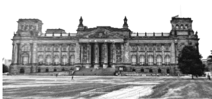
El Reichstag en 1988.