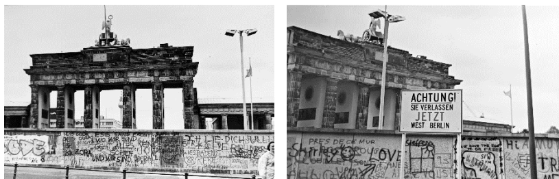
El Muro y la Puerta de Brandemburgo vistos desde el sector occidental en 1988.

Desde el otro lado recibían ayuda, a veces construyendo túneles como el de la calle Franz-Klühs con Friedrichstrasse , que utilizará Otto para ir al encuentro de su viejo amigo Max ( TLM , p. 15, 225, 310). La apertura del Muro, el 9 de noviembre de 1989, es uno de los hitos del siglo XX, que aceleró la caída del régimen y, como en un dominó, de todo el bloque prosoviético. Con la reunificación, el odiado Muro fue derruido, salvo un tramo de 1,3 km.