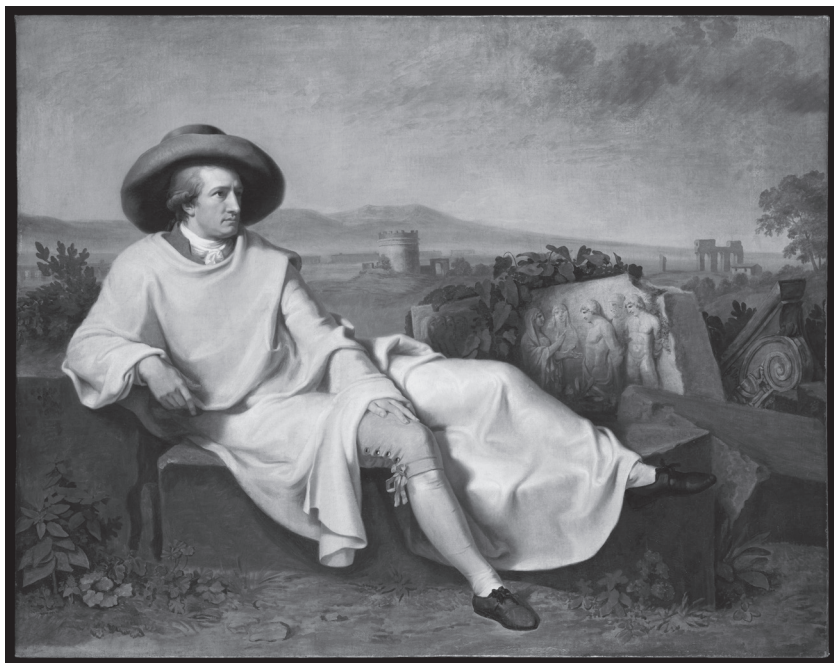
Johann Heinrich Wilhelm Tischbein, Goethe in der römischen Campagna, 1787. Óleo sobre lienzo, 166 x 210,3 cm. Städel Museum, Frankfurt am Main.