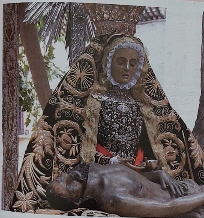
Detalle de la talla de Nuestra Señora de las Angustias.

Archivo General de Simancas. Consejo Real de Castilla, legajo 110, pieza 5.