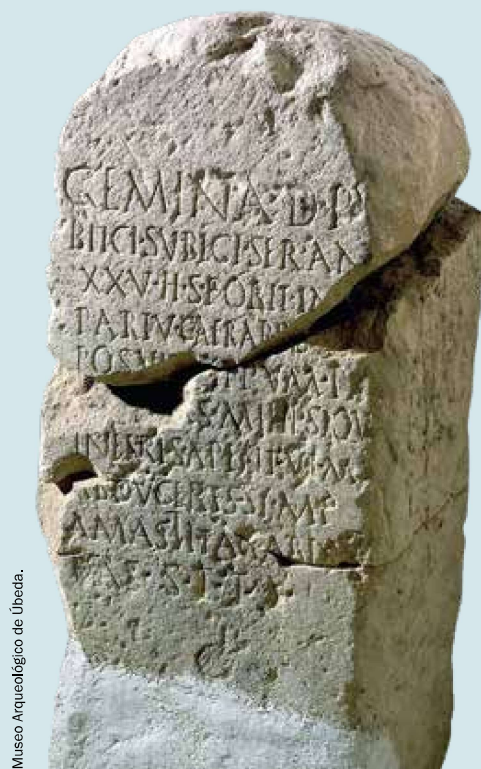
Museo Arqueológico de Úbeda.

Estela funeraria romana. Finales del siglo I e inicios del siglo II. Procedente del Cortijo del Chantre (Úbeda).