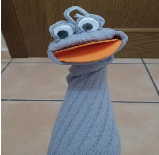
Figura 9. Marioneta del cuento El patito feo.

Nota. La figura muestra la elaboración de una marioneta con un calcetín y papeles reutilizados.