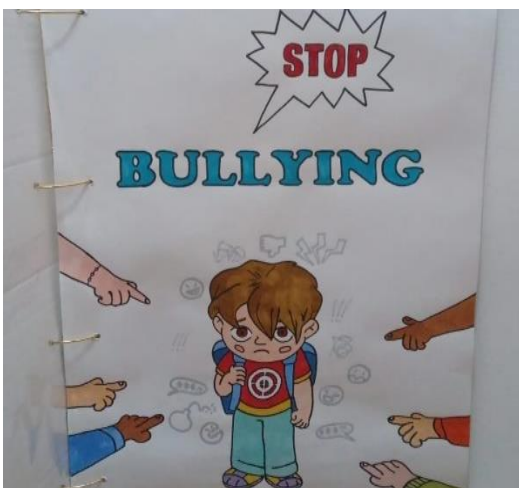
Figura 12. Portada del apartado dirigido a la prevención del bullying.

Nota. La figura muestra el letrero que da a conocer el contenido del capítulo sobre el que se desarrolla la propuesta didáctica y el tema de los cuentos: la prevención del bullying .