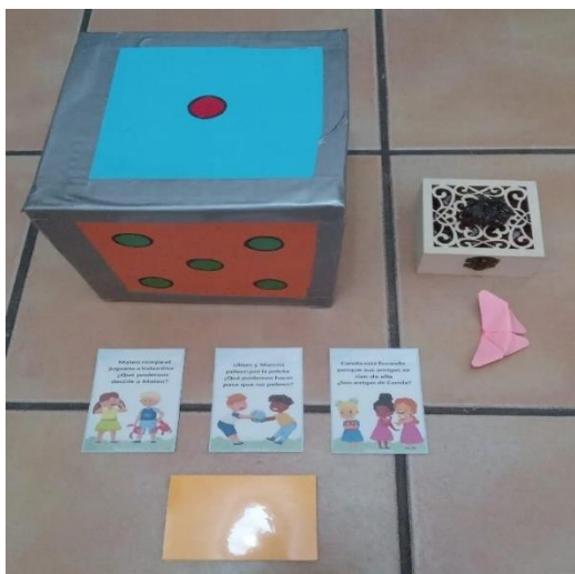
Figura 5. Materiales de la sesión 4 de la propuesta didáctica.

Nota. La figura muestra los recursos que se utilizarán para cumplir con los objetivos de la sesión 4: un dado gigante, una caja con espejo, una piedra mágica y tarjetas con situaciones escolares para reflexionar, todo ello perteneciente a la 2ª actividad; y el resultado de la tarea artística de la 3ª actividad.