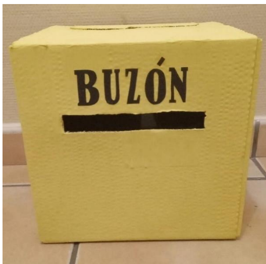
Figura 17. Buzón para la detección de casos de acoso escolar. Oportunidades.

Nota. La figura muestra un buzón de cartón resistente para que cualquier alumno/a del colegio pueda comunicar, de forma anónima, situaciones relacionadas con el acoso escolar, ya sean presenciadas o vividas en primera persona.