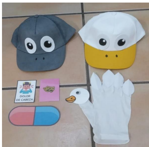
Figura 3. Materiales de la sesión 2 de la propuesta didáctica.

Nota. La figura muestra los recursos que se utilizarán para cumplir con los objetivos de la sesión 2: las gorras de pato-cisne, las tarjetas dramatúrgicas y las píldoras de la 2ª actividad, y el resultado de la tarea artística de la 3ª actividad.