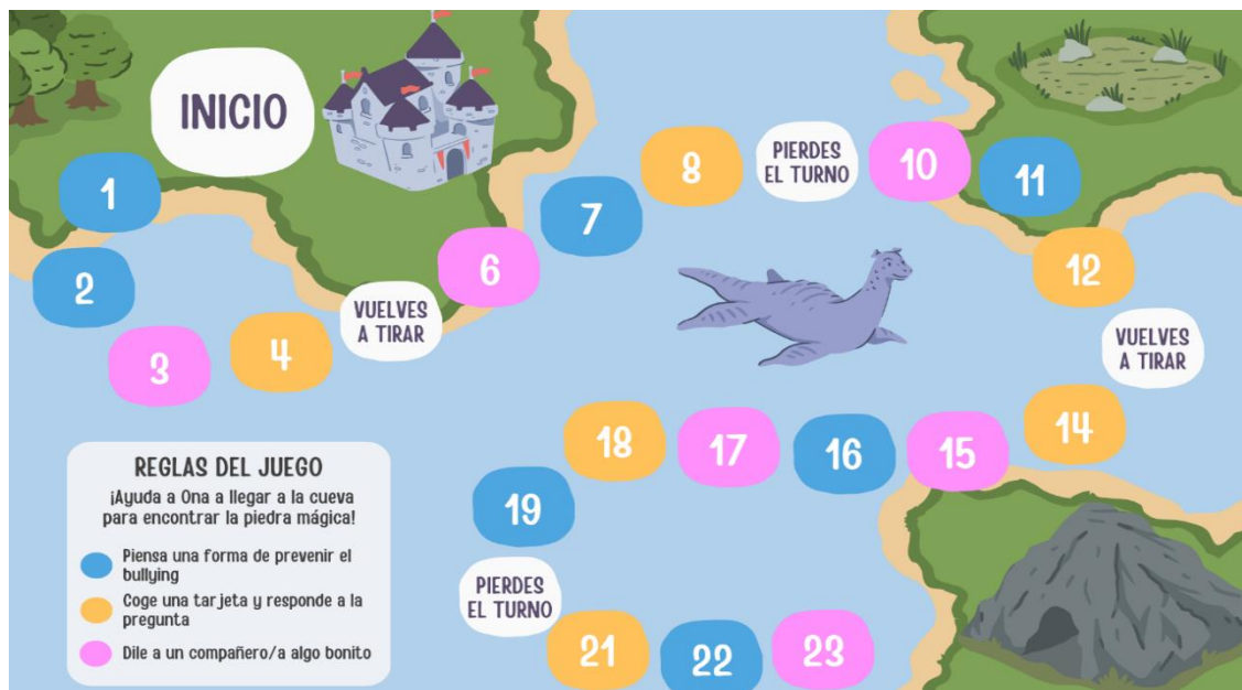
Figura 6. Tablero del juego de mesa de la sesión 4 de la propuesta didáctica.

Nota. La figura muestra el tablero del juego de mesa vinculado al cuento de la cuarta sesión, en donde los alumnos/as, divididos por grupos, deberán llegar a la cueva de la historia superando los retos gracias a todo lo aprendido y el trabajo en equipo. Las casillas especiales son las siguientes: Casilla naranja (el equipo cogerá una tarjeta naranja, color oficial que representa el Día Mundial contra el Bullying , en donde aparece reflejada una situación de abuso, tanto en dibujo como en texto. Los niños/as deberán pensar en una solución para arreglarlo), Casilla rosa (cada miembro del equipo dirá a otro compañero/a algo que le guste de él o ella, como, por ejemplo, su sonrisa, la forma en la que pinta, etc.; o darle una muestra de cariño, como un abrazo) y Casilla azul: el equipo deberá pensar en una norma para prevenir el bullying en el colegio y dictársela a la tutora. Después, se podría hacer con ella una pancarta).