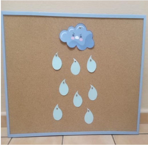
Figura 7. Soporte de la actividad de conocimientos previos.

Nota. La figura muestra una espaldera con un dibujo de nube de tormenta y unos papeles en forma de gota, en donde los niños/as deberán escribir en ellos lo que consideren que es el bullying .