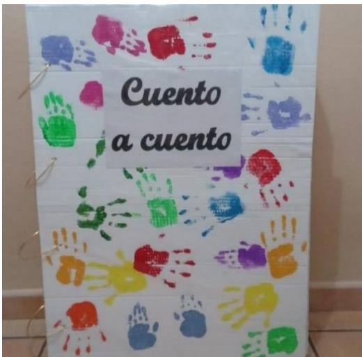
Figura 10. Gran libro de los niños/as.

Nota. La figura muestra un libro hecho de cartón, en donde los alumnos/as irán creando sus hojas según van avanzando las sesiones u otras propuestas.