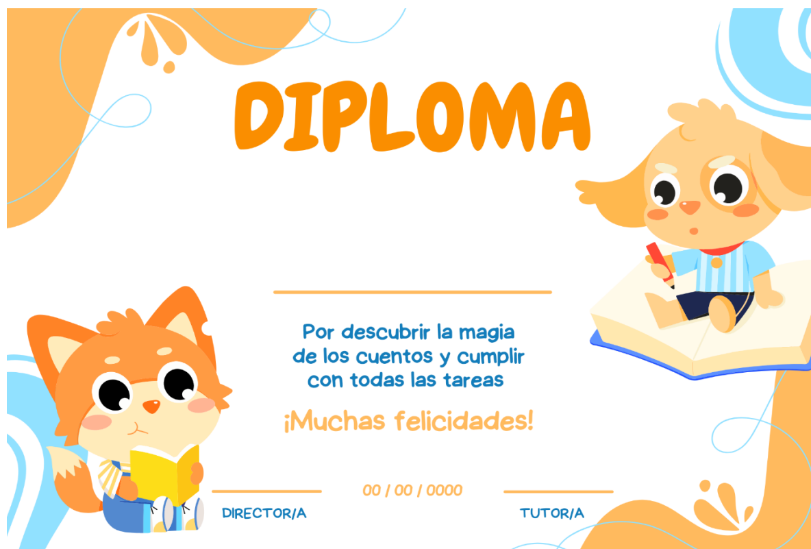
Figura 16. Diploma para celebrar el fin del plan de lectura anual. Oportunidades.

Nota. La figura muestra un diseño de diploma que se le entregaría a cada niño/a por haber conseguido escuchar y trabajar con las obras clásicas y modernas del plan de lectura anual.