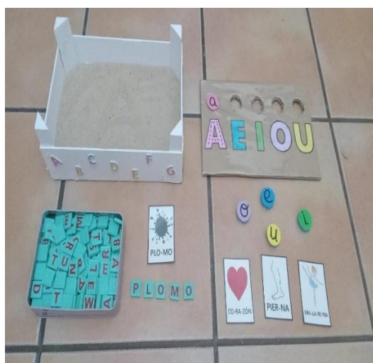
Figura 14. Materiales visuales y sensoriales. Adaptaciones.

Nota. La figura muestra un compendio de recursos cuyo diseño brinda apoyo a los niños y niñas que presentan dificultades a la hora de entender los conceptos de la lecto-escritura: pictogramas, letras con relieve, caja sensorial y juego de vocales.