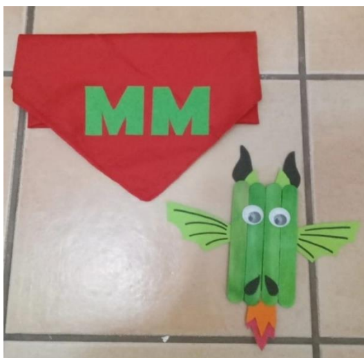
Figura 4. Materiales de la sesión 3 de la propuesta didáctica.

Nota. La figura muestra los recursos que se utilizarán para cumplir con los objetivos de la sesión 3: el pañuelo utilizado en la 3º actividad y el resultado de la tarea artística de la 4º actividad.