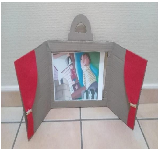
Figura 8. Kamishibai artesanal con las láminas del cuento El soldadito de plomo.

Nota. La figura muestra un teatrillo de papel diseñado para narrar historias mientras se van pasando las ilustraciones.