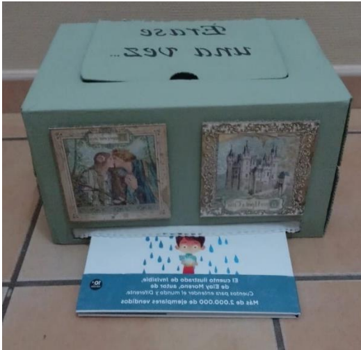
Figura 11. Caja mágica.

Nota. La figura muestra una caja de cartón pintada y decorada con un estilo que evoca al cuento de hadas. Se utiliza para recordar características de las obras leídas.