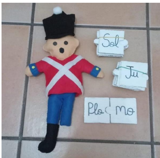
Figura 2. Materiales de la sesión 1 de la propuesta didáctica.

Nota. La figura muestra los recursos que se utilizarán para cumplir con los objetivos de la sesión 1: el muñeco de fieltro del soldadito de plomo para la 2ª actividad sobre la prevención del bullying y las piezas de puzzle utilizadas en la 3ª actividad. Dichas piezas sirven de ejemplo para las demás sesiones.