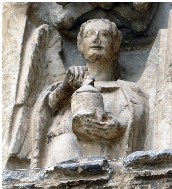
Fig. 3. Maestro de Reims. Portada meridional. Ángel con campana. C. 1280.

También se hallan seres alados tocando instrumentos de forma concertada en los muebles de los órganos para simbolizar el sentido ascendente