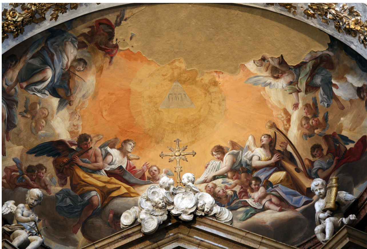
Fig. 9. Mariano Salvador Maella. Adoración del Nombre de Dios . 1782.

Son siete vitrales cada uno con doble instrumento en manos de unos ángeles alados. Responden a patrones estereotipados orientados al historicismo, hecho que también se pueden contemplar en el Convento del Carme de Perelada (1890) 47 . De izquierda a derecha se encuentra una viola de braccio periforme y un triángulo, chirimía y viola con arco de forma oval, arpa y aulós, chirimía y cordófono, laúd y corneta, chirimía y metalófono, y platillos y orpharion frotado. Algunos presentan