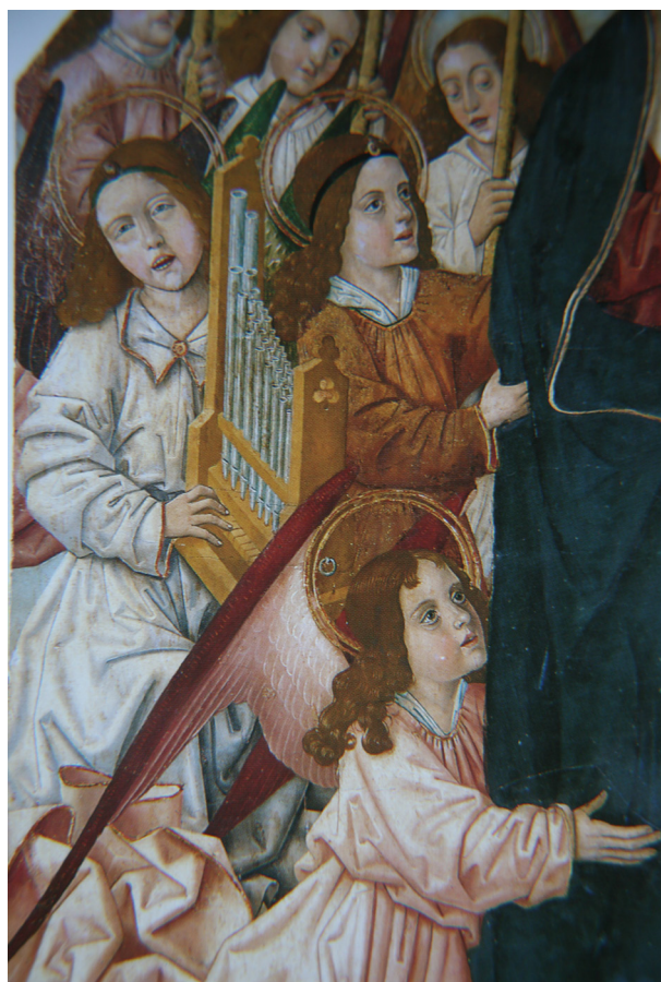
Fig. 7. Maestro de Osma. Retablo de la Virgen de los Ángeles. Detalle del laúd, arpa y flauta de pico. C. 1480.