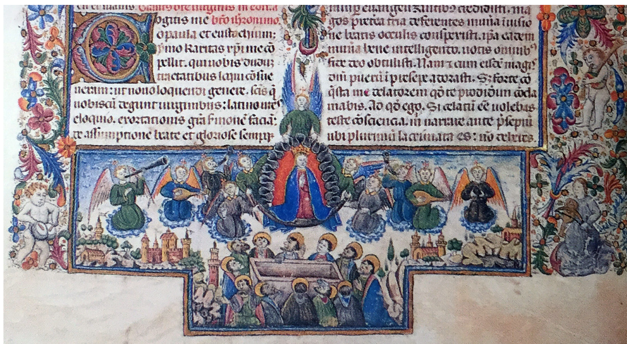
Fig. 6. Taller de Espeja. Asunción de la Virgen. Breviario de Montoya . Fol. 261. C. 1470.