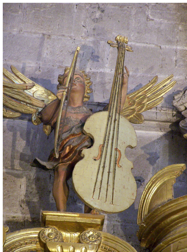
Fig. 4. Domingo de Acereda. Caja del órgano de la epístola. Detalle del ángel con violonchelo. 1652.

de la música 17 . La caja del órgano de la epístola fue realizada por Domingo de Acereda en 1652 y el dorado corrió a cargo de Julio García 18 . En los extremos, a la altura de la base de los tubos de adorno de madera de tesitura de 16', se hallan dos niños semidesnudos que tocan un pífano 19 . A su vez, en el coronamiento, cuatro ángeles adolescentes transportan varios instrumentos, como también se encuentran en el órgano de la catedral de Segovia y en la catedral de México 20 (de izquierda a derecha): un arpa de dos órdenes con las cuerdas dispuestas horizontalmente, un serpentón algo idealizado, una trompeta recta orientada al frente, y finalmente un violonchelo italiano con escotaduras, cuatro cuerdas, clavijero inclinado que descansa en el suelo a la manera de un violón y arco curvado, instrumento que ya había aparecido anteriormente en el Martirio de San Mauricio de el Greco (1580-1583) 21 .