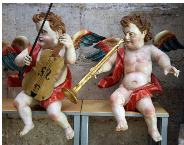
Fig. 5. Familia Sierra. Ángeles músicos . Cúpula de la capilla de la Virgen del Espino. Detalle del violín y la trompeta natural. C. 1760.

Mariano Salvador Maella plasmó en estilo tardo-barroco la bóveda del testero de la capilla de Palafox el fresco La adoración del Nombre de Dios 25 . Esta pintura tiene su precedente en el Quinientos con el tema de la exaltación de la cruz y más tarde en las alegorías a la Eucaristía procedentes de los grabadores flamencos de Rubens (convento de las Descalzas de Madrid) y luego en el primer tercio del siglo XVII Abraham Willemsem (cuadro de igual asunto que se halla en el Museo Nacional de Escultura). En este caso de El Burgo de Osma destaca en la parte central el Tetragrámaton hebreo (YHWH) dentro de un triángulo iluminado, mientras las imágenes quedan dispuestas simétricamente y semicircularmente con predominio de los tonos rojos, azules y ocre 26 . Las figuras aladas de la izquierda interpretan la melodía, mientras que los de la derecha ejecutan el acompañamiento junto a la percusión. El primero toca un violín con un arco convexo que apoya sobre el hombro, y le siguen una chirimía, un traverso y dos ángeles de diferente edad cantando con una partichela alargada. Enfrente, hay dos cantores más, uno