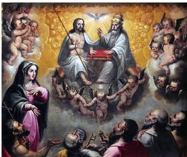
Fig. 8. Martín Gonzalez. Retablo de la Virgen del Espino. Glorificación de la Virgen. 1650. Fotografía: Autor.

También pertenece al precitado maestro de Osma la tabla de la Virgen de los Ángeles, fechada en 1480. María, según el relato del Cantar de los Cantares (1,1-16), está sentada, orante y coronada, rodeada por una corte de ángeles músicos 39 . Los instrumentos pertenecen a familias dispares: un órgano portativo con dieciséis tubos cilíndricos junto a una fídula de arco de tres cuerdas, un arpa, una flauta de pico de siete agujeros y un laúd, con el fin de producir sonoridades dulces y suaves 40 . Por encima hay sendos albuges fabricados en hueso que funcionaban como bajo de las flautas, de pabellón cónico y cinco agujeros que también se puede ver en una mocheta de la portada de la Majestad de la colegiata de Toro 41 . Curiosamente, sorprende la morfología del arpa de tipo oriental, llamada gank , que el artista pudo tomar de un códice medieval y que también se encuentra en el Libro de Ajedrez, Daos y Tablas de Alfonso X el Sabio, códice TI6 de la Biblioteca de El Escorial, con la caja de resonancia curva y extendida hacia arriba, quedando el clavijero recto en la parte inferior para las diecisiete cuerdas verticales 42 .