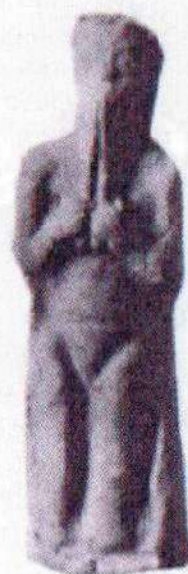
Figura 2. Terracota paleobabilónica de un músico de gi-gid 6