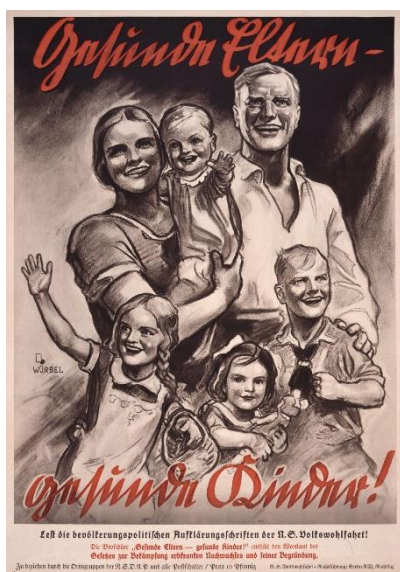
Figura 5 Cartel publicitario de la política demográfica

Los programas natalistas estaban exclusivamente dirigidos a aquellas mujeres consideradas auténticamente alemanas, siempre bajo un enfoque racial. Su propósito era colocar la maternidad en el centro del discurso, presentándola como la tarea más valiosa que una mujer podía desempeñar para garantizar la continuidad de la raza y servir al Estado.