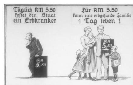
Figura 1 Cartel propagandístico: el precio de un discapacitado

La gran utilidad que los nazis sacan a la propaganda viene del objetivo que esta tenía. Por un lado, la validación y refuerzo constante al régimen con un ensalzamiento a sus ideas y prácticas. Siguiendo esta línea, se conseguía que el pueblo alemán no solo tolerase o aceptase el nacionalsocialismo, sino que, además, llegase a alabarlo y a convertirse en fervientes adeptos. De esta forma conseguían la última de sus finalidades, aprobación absoluta de las decisiones del Führer.