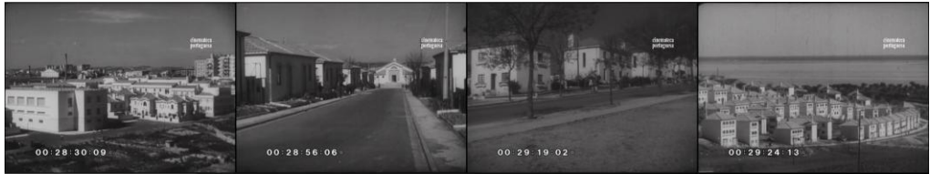
Figura 6. Fotogramas del documental Quinze Anos de Obras Públicas.

Português 84 , 1949), las vistas de las viviendas unifamiliares de una o dos plantas exponen las principales características de estos barrios sociales construidos bajo la iniciativa de Duarte Pacheco e inspirados en el imaginario vernáculo y popular de la casa portuguesa , concebida por el arquitecto Raúl Lino (Pereira & Fernandes, 1987) y “asociada a la casa unifamiliar burguesa” (Tavares, 2013, p. 23). A la vez, los planos del conjunto con los que termina este último reportaje y la introducción retrospectiva del plan de ordenación del Bairro dos Olivais ( Imagens de Portugal 196 , 1960) ponen de relieve el ideal rural de estos asentamientos, así como la distancia que los separaba y diferenciaba del tejido urbano (Mota, 2019), pues se ubicaban en las zonas suburbanas por el menor precio del suelo y siguiendo criterios de segregación socioespacial (Pereira, Queirós, Silva, & Lemos, 2018).