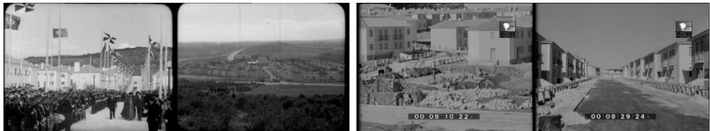
Figura 7. Fotogramas de los noticiarios cinematográficos Jornal Português 84 e Imagens de Portugal 128.

En el Congresso de 1948, los arquitectos portugueses “establecen una línea de ruptura con el poder”, introduciendo “los principios de la Carta de Atenas, desvinculándose de una actitud historicista y la adhesión a los principios del estilo internacional” (Almeida, 1993, pp. 140-144) y reclamando “la industrialización y la participación de los arquitectos en la resolución del problema de la vivienda sin constreñimientos ni obligaciones de estilo” (Tostões, 1997, p. 42). Las reflexiones esbozadas en el Congresso asumieron la construcción en