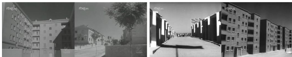
Fig. 2. Fotogramas de los noticiarios cinematográficos NO-DO 342B y NO-DO 603A (Fuente: Filmoteca Española, Archivo RTVE).

Mientras esto sucedía y coincidiendo con el aniversario del alzamiento militar que dio origen a la Guerra Civil, la propaganda del noticiario estatal presentaba la inauguración de los bloques y grupos construidos en el Gran Madrid por la Comisaría para la Ordenación Urbana de Madrid y sus alrededores -COUMA- (NO-DO 342B, 1949), como parte de las labores de nueva urbanización de la reconstrucción en el cinturón de suburbios de la periferia madrileña, habitado en gran medida por emigrantes rurales. La demolición de chabolas y asentamientos de infravivienda y su paulatina sustitución por los grupos de vivienda de promoción estatal se difundieron ampliamente en la propaganda cinematográfica, acompañando las entregas de llaves y las visitas oficiales (NO-DO 603A, 1959).