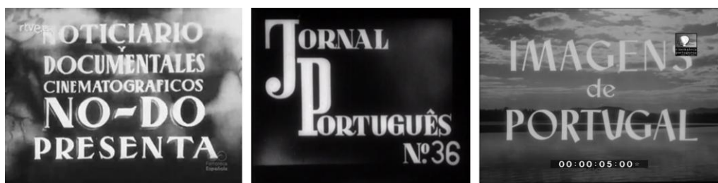
Fig. 1. Fotogramas de las cabeceras de los noticiarios cinematográficos NO-DO (Fuente: Filmoteca Española, Archivo RTVE), Jornal Português (Fuente: Cinemateca Portuguesa-Museu do Cinema) e Imagens de Portugal (Fuente: Cinemateca Portuguesa-Museu do Cinema).

ro del Trabajo español de 1938 (Decreto de la Jefatura del Estado de 9 de marzo), recogieron el derecho a la propiedad y convirtieron al Estado en el principal promotor de hogares para las clases trabajadoras con condiciones higiénicas y de salubridad, puesto que el hogar doméstico era el centro de expansión del espíritu, el marco que encuadra la familia 5 . La primera noticia del NO-DO sobre vivienda destacaba estas características a través de la inauguración de la Colonia de Casas Baratas "General Moscardó" (NO-DO 10A, 1943), cuando la voz en off adoctrinaba sobre la eficacia, caridad y paternalismo del Régimen franquista.