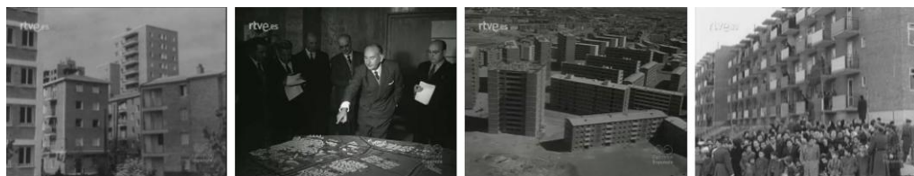
Fig. 4. Fotogramas de los noticiarios cinematográficos NO-DO 670B, NO-DO 790B, NO-DO 821B, y NO-DO 943C.

El Gran San Blas, propuesto como un modelo de crecimiento programado autosuficiente, fue la principal operación urbanística del citado Plan de Urgencia Social, el mayor proyecto construido por la OSH y el barrio con más presencia en el noticiario NO-DO. Por tanto, el cine reflejó sus diferentes etapas constructivas: desde las labores previas de nivelación del terreno (NO-DO 847B, 1959), su ordenación urbana en la visita del ministro de la Construcción francés a los nuevos poblados (NO-DO 802A, 1958), los bloques ya finalizados (NO-DO 943B, 1961) y la gran barriada concluida y habitada (NO-DO 1020B, 1962).