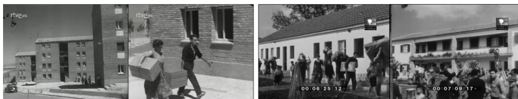
Fig. 3. Fotogramas de los noticiarios cinematográficos NO-DO 764A y Imagens de Portugal 84.

Con motivo de la inauguración del Casa Sindical de Madrid ( NO-DO 670B , 1955), el noticiario exhibe las maquetas expuestas de las realizaciones nacionales y las visitas oficiales a los grupos terminados de San Blas y La Quintana, iniciando así la amplia serie de noticias que daban cuenta de los avances de los planes nacionales y sindicales de la vivienda. Las masivas realizaciones de la Obra Sindical del Hogar que caracterizaron los 50 (Juber, 1974, p. 44), especialmente a partir de 1954 con la aprobación del Plan de viviendas del “tipo social” del INV, el Plan Sindical de Vivienda y la Ley de Viviendas de Renta Limitada, se difundieron a través de las inspecciones de las jerarquías políticas y entregas de llaves a los propietarios, como sucedió durante la inauguración del Poblado San Vicente de Paul y el Grupo “San José Obrero” ( NO-DO 707B , 1956).