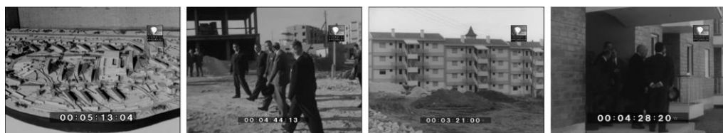
Figura 9. Fotogramas de los noticiarios cinematográficos Imagens de Portugal 196, Imagens de Portugal 236, Imagens de Portugal 263 e Imagens de Portugal 274.

De una forma semejante al Gran San Blas en Madrid, el Bairro dos Olivais de Lisboa se convirtió en la operación urbana más representativa mostrada por la propaganda en la década de 1960, al exponer desde la planimetría de la ordenación general y las maquetas de sus edificios ( Imagens de Portugal 196, 1960), la adquisición de terrenos para las nuevas construcciones ( Imagens de Portugal 204, 1960), las visitas a las obras en construcción de casas para funcionarios y de casas económicas ( Imagens de Portugal 236, 1961, e Imagens de Portugal 263, 1962), los edificios residenciales en construcción y finalizados ( Imagens de Portugal 245, 1962), y la inauguración de viviendas y bloques ( Imagens de Portugal 274, 1963). Este último reportaje incluía una de las escasas visitas a los interiores domésticos que, sin embargo, apenas resultaron captados por la cámara cinematográfica. Tampoco NO-DO mostró por dentro muchas viviendas, con notables excepciones como NO-DO 135B (1945) con el barrio del Pilar, cuyos interiores y mobiliario fueron diseñados por el Servicio de Ajuares de la Sección Femenina, que guardaban notables similitudes con las viviendas mostradas en el NO-DO 930B (1960), con la visita de Carmen Polo al bloque construido por el Patronato Nuestra Señora del Carmen en la barriada del Cerro de San Blas.