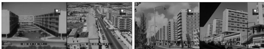
Figura 8. Fotogramas de los noticiarios cinematográficos Imagens de Portugal 77 e Imagens de Portugal 180.

altura para resolver la carestía de viviendas económicas y tuvieron una aplicación directa en los grandes conjuntos residenciales promovidos por las Habitacões Económicas - Federação das Caixas de Previdência [HE-FCP] (Tavares & Duarte, 2018, p. 205), limitados a cuatro plantas en el caso de las Casas de Renda Económica. No obstante, son los barrios promovidos por la Câmara Municipal de Lisboa los que configuraron la imagen paradigmática de las nuevas propuestas, tanto por su reconocimiento en el ámbito profesional como por su difusión en la propaganda cinematográfica. En concreto, el Prémio Municipal de Arquitectura otorgado en 1954 al Bairro das Estacas, proyectado a partir de 1949 por Ruy Jervis d'Athouguia y Formosinho Sanchez, le sirvió de pretexto al noticiario Imagens de Portugal para exhibir un profundo reportaje de este al detenerse en la extensa plataforma ajardinada que se prolongaba bajo los edificios, elevados sobre el suelo mediante pilotis (Tostões, 1997, p. 196) ( Imagens de Portugal 77, 1956).