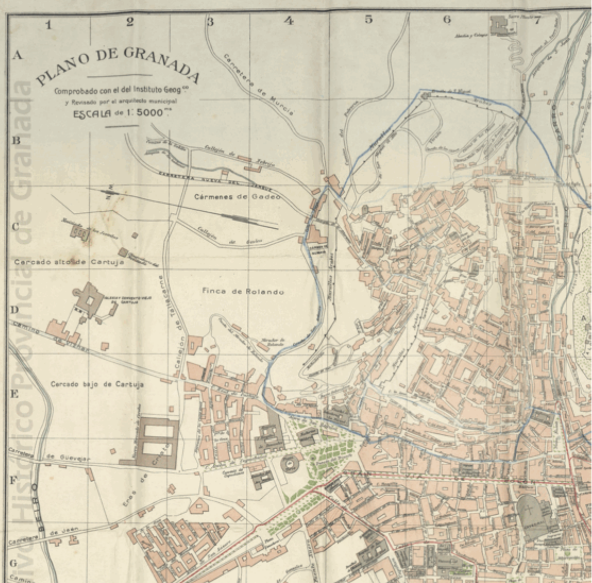
7. Ubicación de los principales lavaderos de Aynadamar en Granada. Detalle del Plano de Granada. A. Colomer/Fenoy delineante. Dirección General del Instituto Geográfico y Estadístico, 1910. Archivo Histórico Provincial de Granada. Colección de planos. Signatura: P-0012

prender con mayor dimensión, la cultura dominante de la sociedad que los construyó. La etapa, aunque cercana, es un tiempo irremediamente perdido, pero que puede ser recreado y conocido teóricamente, a través de la recuperación de este grupo de lavaderos comprendidos en el área de influencia de la acequia de Aynadamar.