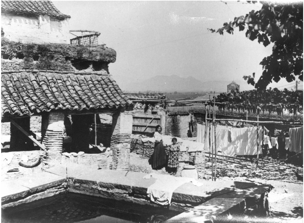
6. Anónimo. Lavadero público junto a la Puerta Monaita (h. 1900).

De los citados, habría que detenerse más pormenorizadamente en el lavadero de los Gitanos. En el fondo gráfico del Archivo Histórico Municipal de Granada existe una fotografía catalogada con el título de Lavadero público junto a la puerta Monaita , (h. 1900), que bien podría ser al que se refiere la documentación del año 1852 (Fig. 6).