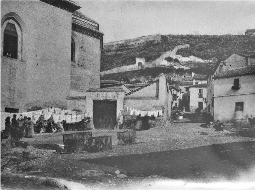
4. Anónimo. Cuesta de la Alhacaba (h. 1900). Archivo Histórico Municipal del Ayuntamiento de Granada. Fondo fotográfico/Signatura: 00.015.13