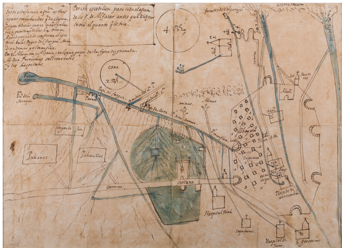
3. Desconocido. Plano de la acequia de Ynadamar y de los interesados que riegan y se aprovechan de ella. Letra D. núm. 1. pieza 14. n. 67. Aproximadamente s. XVII. Archivo Histórico de la Facultad de Teología de Granada

su recorrido en la Alcazaba Vieja. Este ramal también era conocido por los nombres de San Nicolás, San Miguel, San José y San Andrés, en función de las parroquias a las que alimentaba (Jiménez, 1990: 42 y ss.).