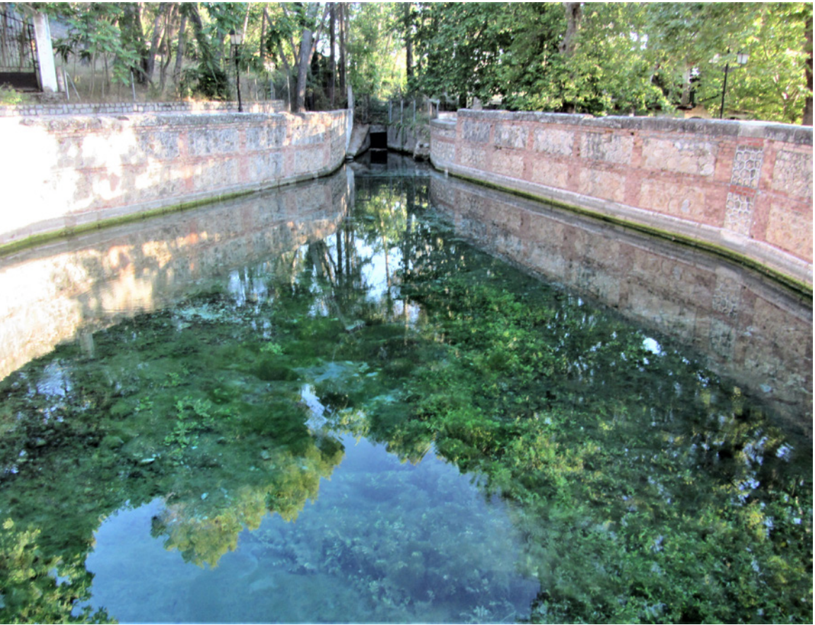
1. Nacimiento de Fuente Grande en Alfacar (Granada).

fueron la causa de que las obras se finalizasen bajo el reinado de Abd Allah, nieto del anterior (González, 1996: 15) 4 . La utilización legal de las aguas tanto de fuente y acequia, desde el momento de la construcción de ésta, siempre correspondió a las poblaciones y tierras de influencia y paso del manantial hasta entrar en el Albayzín. De este modo, el agua de la fuente de Aynadamar (Fig. 1), era aprovechada por las poblaciones de Víznar, El Fargue y Granada, además de fertilizar las tierras durante su trascurso y permitir una toma para la Abadía del Sacromonte.