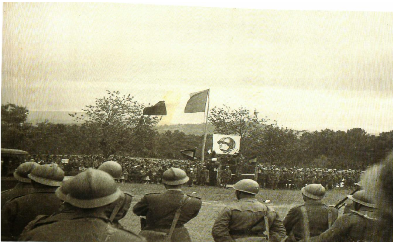
Trespaderne. 15 de mayo de 1937. Durante una ceremonia en las afueras del pueblo. Se puede ver a Teruzzi, jefe de los CCNN y el Comandante del CTV, Bastico, pasando revista a las tropas.