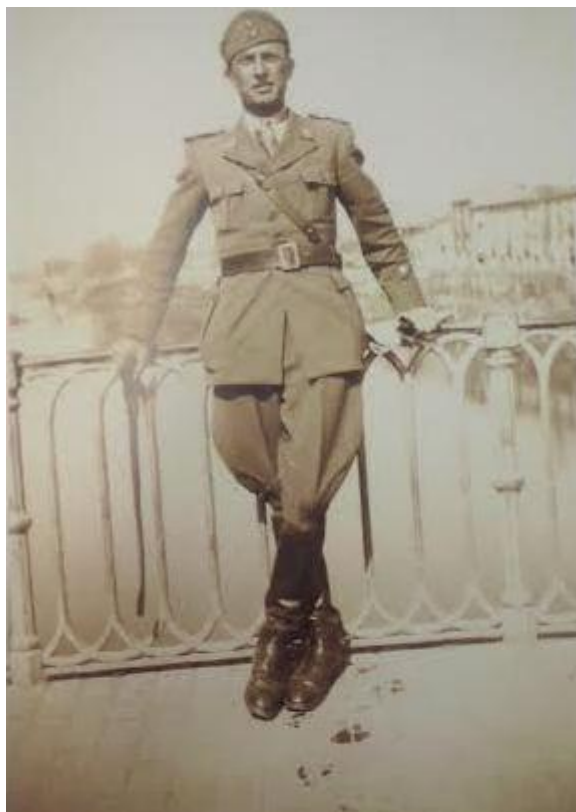
Oficial italiano en el puente de San Carlos III. 1937. (Miranda de Ebro).

(SÁEZ REDONDO, J.A. y PRECIADO MENÉNDEZ, L. Op., Cit.)