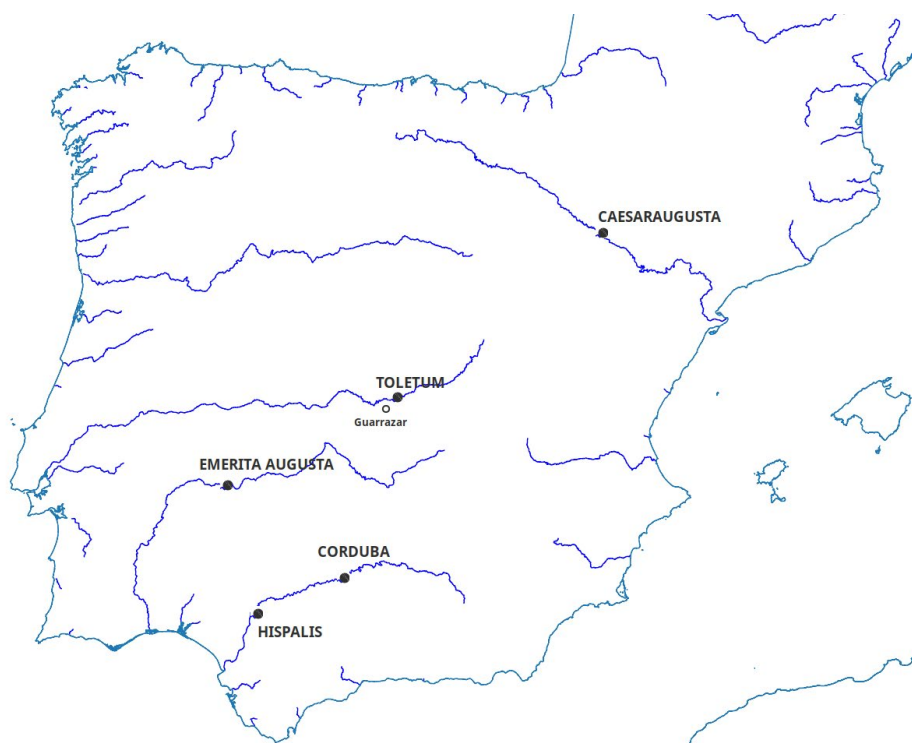
Fig. 1: Mapa de situación del yacimiento de Guarrazar.

el marco de la gran propiedad: se han identificado varias villas e infraestructuras de riego romanas, tanto presas como canales, diseñadas para regar superficies no muy extensas y que continuaron en uso hasta el Medioevo. 9 Uno de los valles así aprovechados era el del Guajaraz, 10 un pequeño afluente del Tajo que discurre a unos dos kilómetros de Guarrazar. Aunque la Toledo tardoimperial no fue un centro urbano de primer orden, se considera actualmente que su importancia fue bastante superior a lo sostenido en el pasado: 11 las villas tardorromanas de la margen meridional próximas a la ciudad tendrían para las élites toledanas una finalidad de ocio además de su función económica.