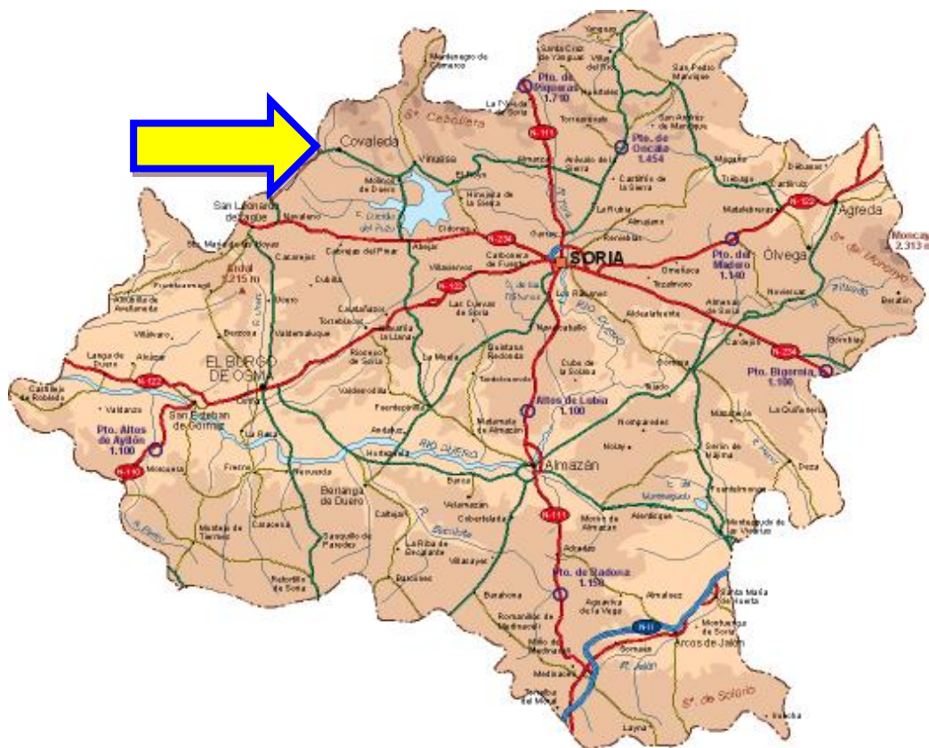
Figura 2: Mapa de la provincia de Soria