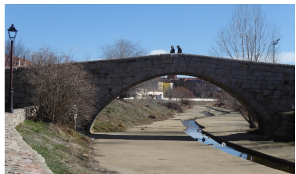
Fig.6. Puente Sancti Spiritu sobre encauzamiento en cemento del Río Chico. Foto de la autora, febrero 2018.