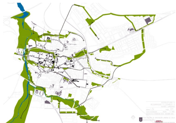
Fig. 1. Sistema de parques propuesto por el IUU en el PGOU de 2005. El plan dice que el sistema Adaja-Río Chico se debería pensar como 'el corazón de una red de espacios libres, primero un espacio central para un proyecto integral de parques y corredores verdes...', que permiten un programa con alcance territorial ampliable a todo el municipio... y que, a través del sistema de cañadas y caminos, permitiría abordar en positivo el importante paisaje abulense, estructurado por una rica red de caseríos y lugares singulares (PGOU 2005)

sus fracturas y sus expectativas que no hay espacio para desmenuzar, pero en cualquier caso la imagen que permanece en el imaginario colectivo para la ciudad es la del oppidum in raris (Jiménez, 2018, p.176). Sin embargo naturaleza e historia maltratadas se revelan en unas pocas huellas contra ese paisaje actual anodino. De hecho, en parte apoyado en dichos componentes, la ciudad tiene “dibujado” un posible esqueleto director para su sistema de espacios libres, mayoritariamente en periferia, incorporado como imagen/discurso al Plan General de Ordenación Urbana de 2005 –aún vigente a 2018– (fig. 1). Y si bien ni gestores ni ciudadanía parecen haberlo incorporado a su imaginario como futura imagen ampliada viable de la ciudad patrimonio, unos –los gestores– por la propia dinámica urbanística, lo “consiguen” –como Sistema General de Espacios Libres– y otros –los paseantes– lo usan. No todo está perdido.