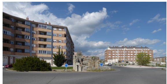
Fig. 5. Rotonda con restos de Ermita Virgen de las Aguas.