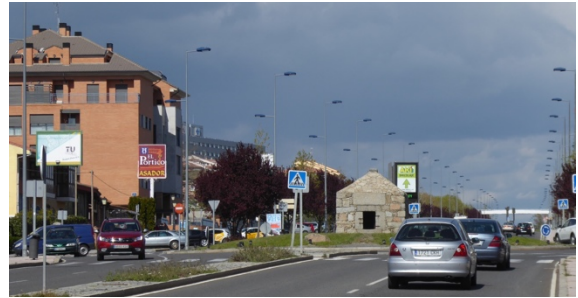
Fig.4 Arqueta. Decía Rodríguez Almeida (2010, Diario de Ávila) sobre ella 'su registro epigráfico, que estaba al borde de la carretera de Madrid, lado Norte, hoy está bufonescamente plantado, todo de piedra nueva, en medio de una rotonda en la carretera, a 300 m. de su emplazamiento original...Y así, más o menos, va todo nuestro grandilocuentemente llamado "Patrimonio de la Humanidad". Triste destino.

debiera ser hecho, pero nos atrevemos a apostar que en esta visión no será nunca un convidado de piedra (Calzolari 1999, p.228) 7 .