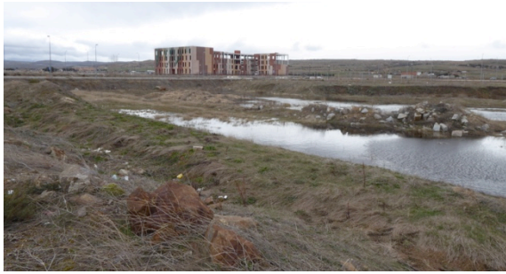
Fig.7. Valle Amblés. Periferia fantasma urbanizada e inundada al Sur. Foto de la autora, marzo 2018.