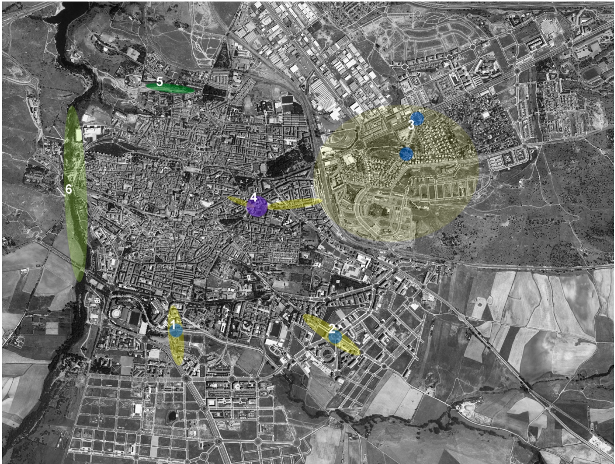
Fig. 8. Fig. Ortofoto de Ávila 2017, con somera localización de algunos de los focos y ámbitos sobre los que podría pivotar ese sistema de espacios libres periférico-patrimoniales. 1. Puente Sancti Spiritu / Río Chico / Calzada cordel – eje norte-sur 2. Ermita virgen de las aguas / camino de Santiago – eje convento de Santo Tomás etc. 3. Arquetas y sistema de traída de aguas. 4. Acueducto / ruinas Convento Gordillas. 5. Jardín de Sefarad –antiguo cementerio judío recuperado como espacio público patrimonial por el equipo LAB PAP). 6. Estructuras diversas en torno al río Adaja, en proceso. Etc. Elaboración de la autora.

Incorporar estas preexistencias a un discurso patrimonial territorial exige amplitud de miras. Parece que como sociedad tenemos mucha capacidad para abstraernos sobre formas del patrimonio perfectamente delimitadas, conservar un resto en una vitrina. Las arquetas y las ruinas de ermitas en rotondas no son más que el caso extremo